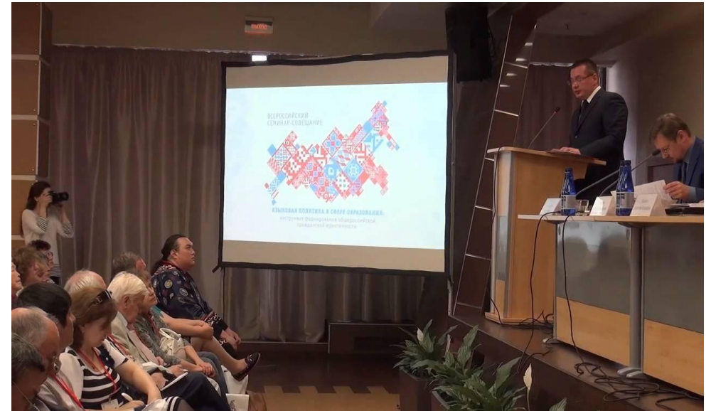
Всероссийский семинар-совещание «Языковая политика в сфере образования: инструмент формирования общероссийской гражданской идентичности»