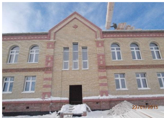
«Создание духовно-просветительского центра в г. Исилькуле»