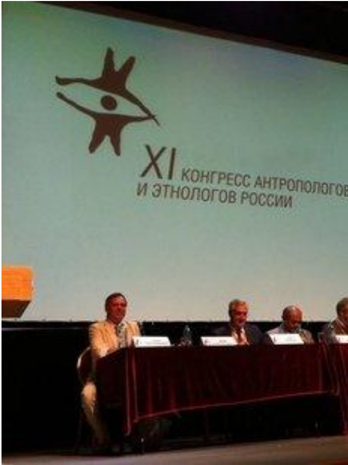
XI Конгресс антропологов и этнологов России по теме "Контакты и взаимодействие культур"