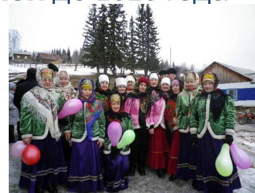
15 региональный фестиваль «Играй гармонь, живи частушка»