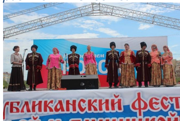
«Любо, братцы! Любо!»

2. Поддержка региональных программ, направленных на формирование и укрепление гражданского патриотизма и российской гражданской идентичности, этнокультурное развитие народов России и поддержку языкового многообразия на территории Российской Федерации – 3 182,6 млн. рублей до 2020 года