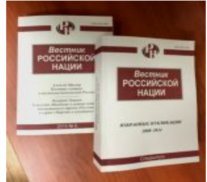
«Вестник российской нации». 2000 экземпляров