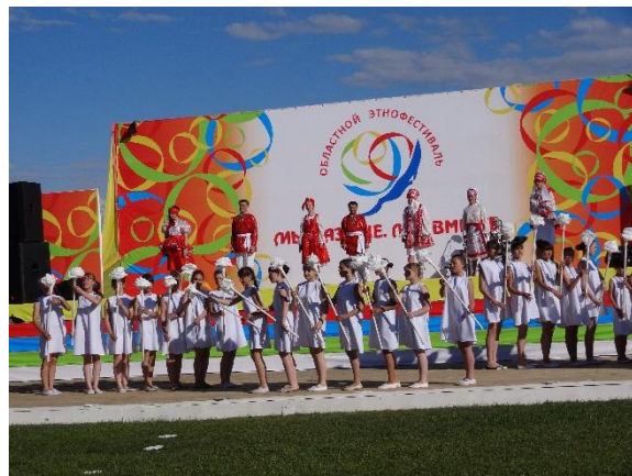
Областной этнофестиваль «Мы разные. Мы вместе!»