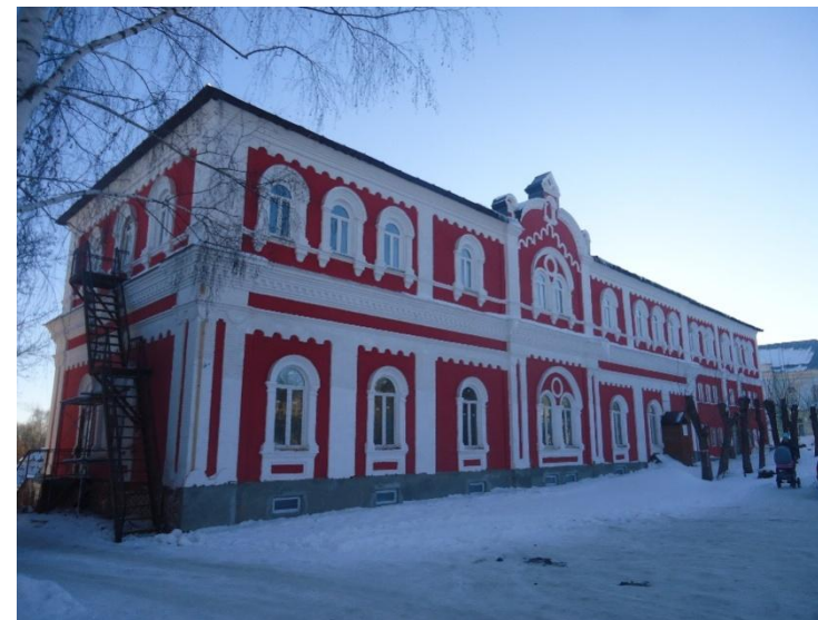
«Развитие Культурно-просветительского центра г. Краснослободск»