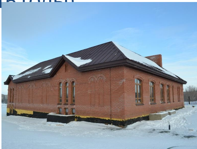
«Духовно-просветительский центр, Оренбургская область г. Орск»

2 882,4 млн. рублей в период (2014 -2016 годы)