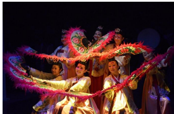
150-летие добровольного переселения корейцев в Россию

2. Поддержка региональных программ, направленных на формирование и укрепление гражданского патриотизма и российской гражданской идентичности, этнокультурное развитие народов России и поддержку языкового многообразия на территории Российской Федерации – 3 182,6 млн. рублей до 2020 года