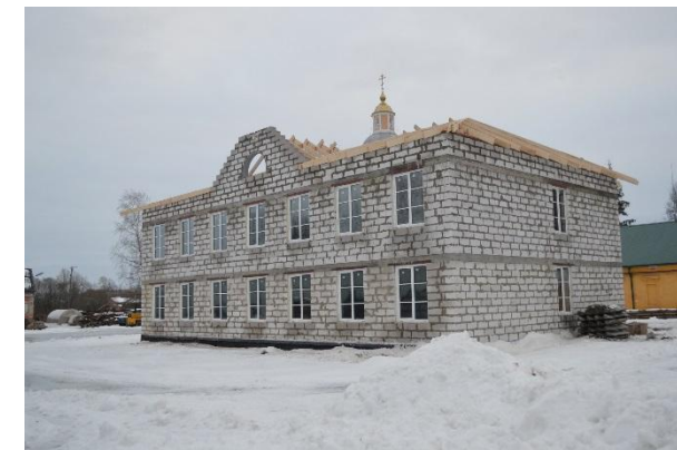
Создание и развитие духовно-просветительского центра, г. Боровичи