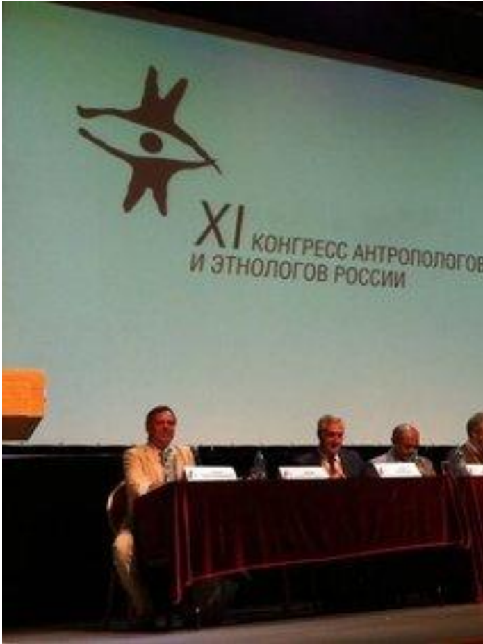
XI Конгресс антропологов и этнологов России по теме "Контакты и взаимодействие культур"