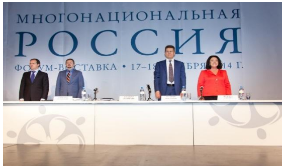
Форум-выставка «Многонациональная Россия»