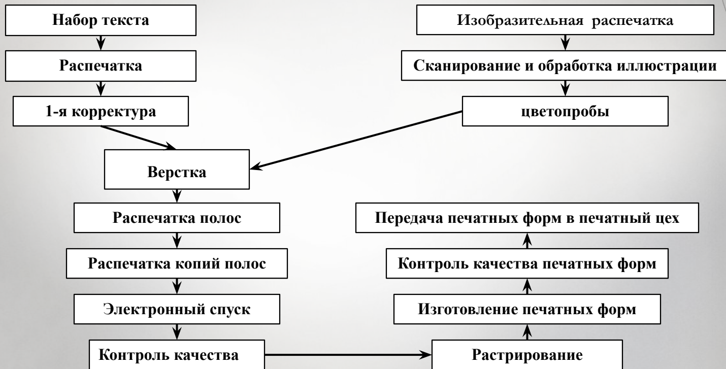
Схема технологического процесса допечатной подготовки (технология CtP)