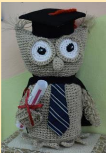
Хранительница речевых традиций Совунья Говоруша