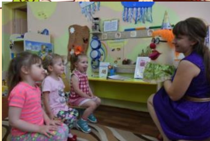
Авторское пособие Клоунесса Пуговка для проведения артикуляционной гимнастики