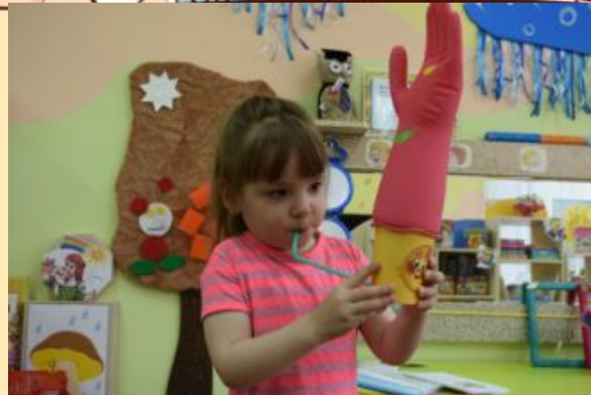
Авторское пособие «Волшебная перчатка» для развития силы выдоха