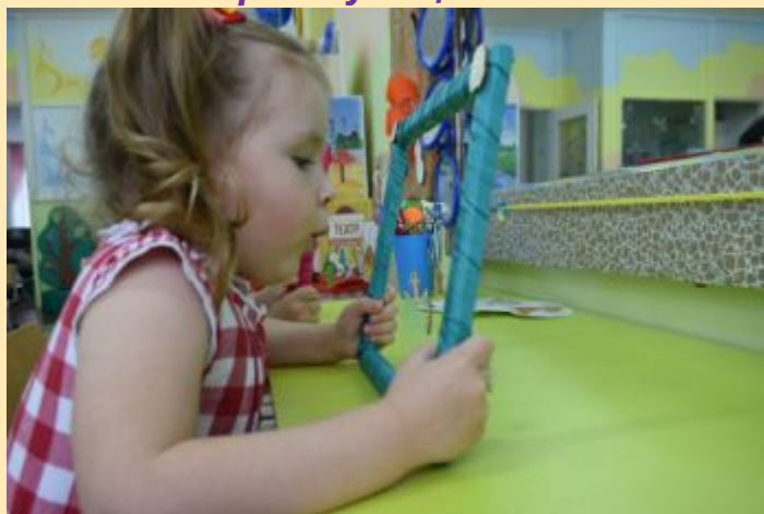
Авторские игровые пособия «Футбол», «Волшебная рамка» для развития речевого дыхания