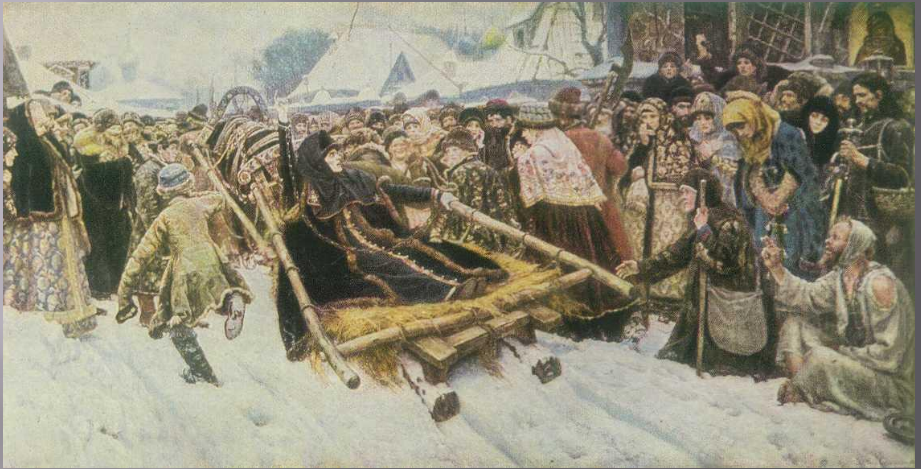
В.И Суриков «Боярыня Морозова»