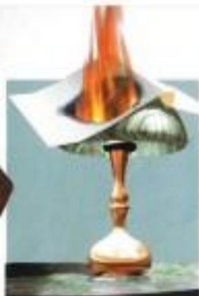
Затмение электrolамп горючими материалами (бумагой, тканью)