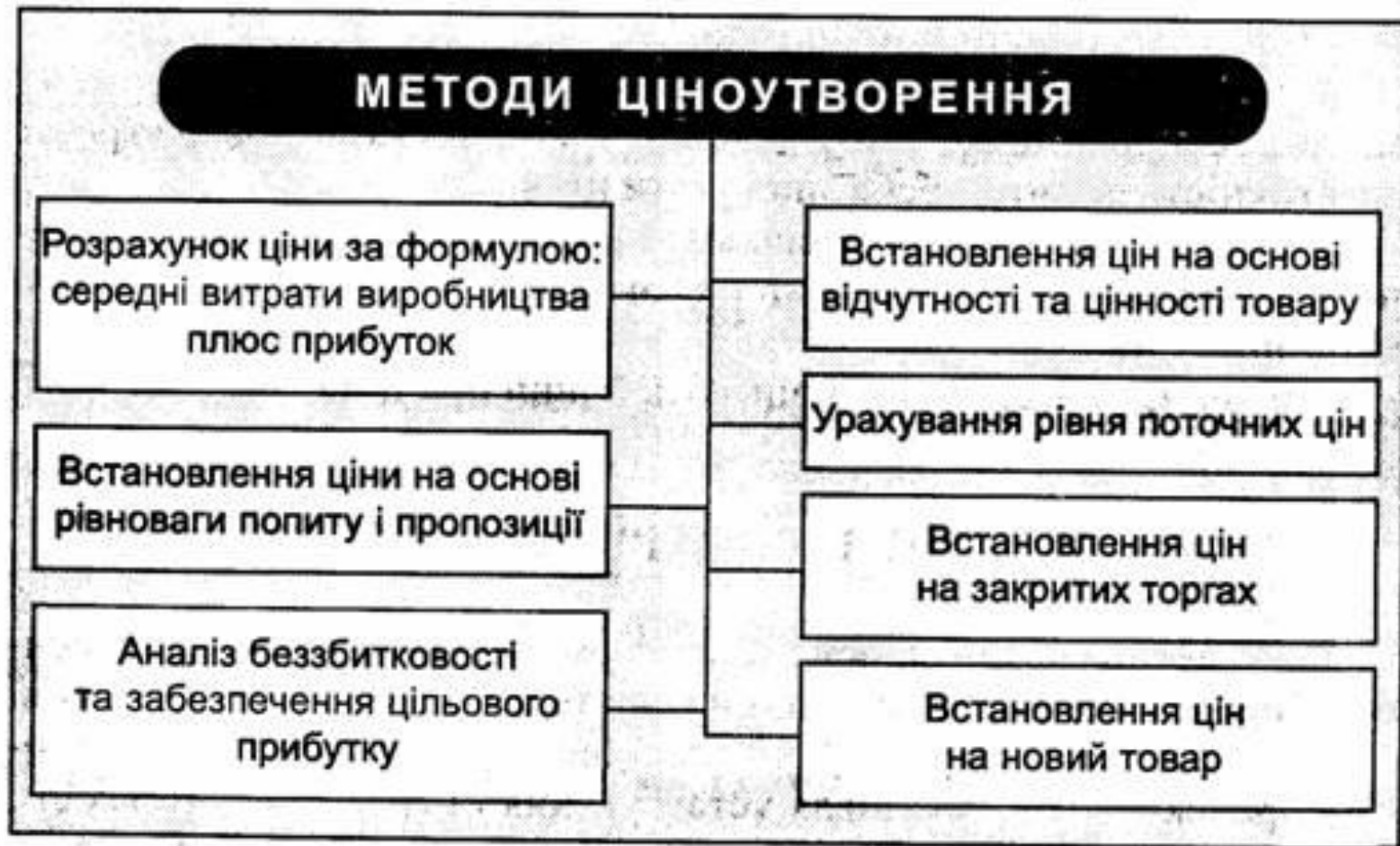
Рис.2 Система методів ціноутворення у ринковій економіці.

Є багато методів ціноутворення. І кожна фірма має право обрати той з них, який відповідає її інтересам.