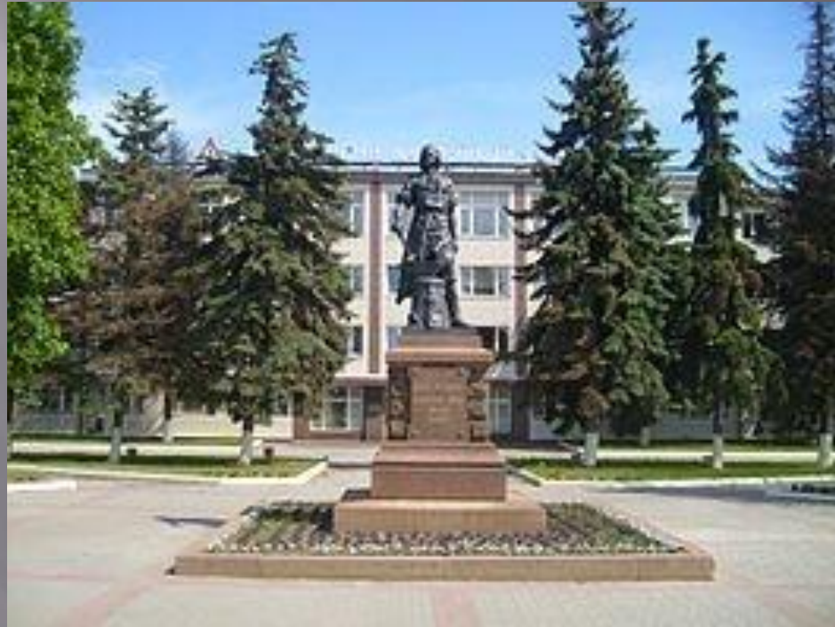
Памятник Петру I