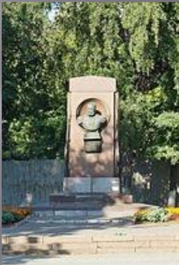
Памятник С.И. Мосину