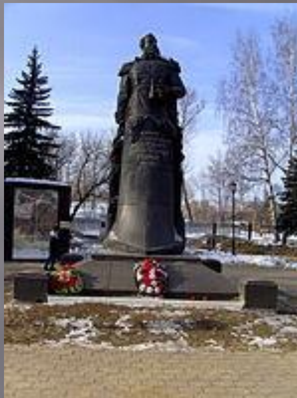
Памятник В.Ф. Рудневу