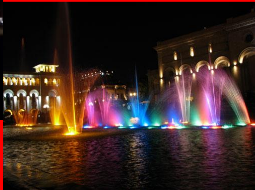
Площадь Республики Ереван