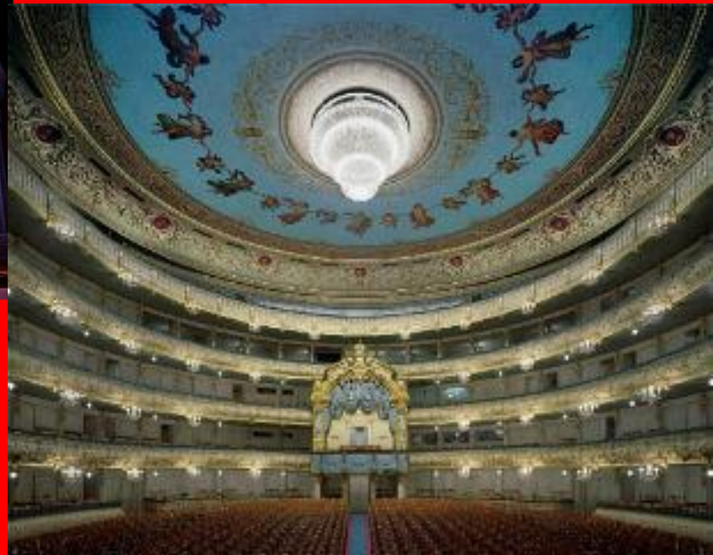
Армянский академический театр оперы и балета имени А. А. Спендиарова