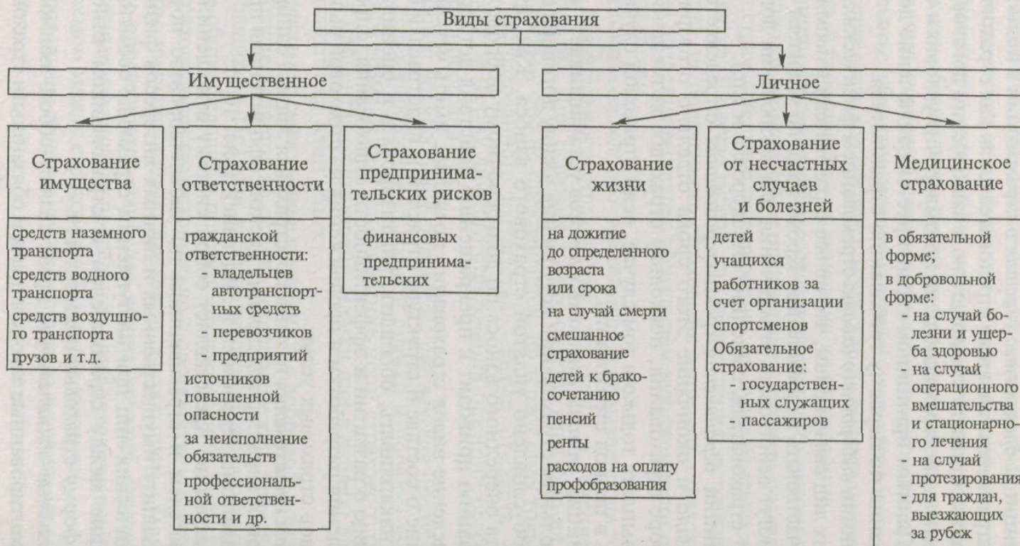
Рис. 10.1. Виды страхования