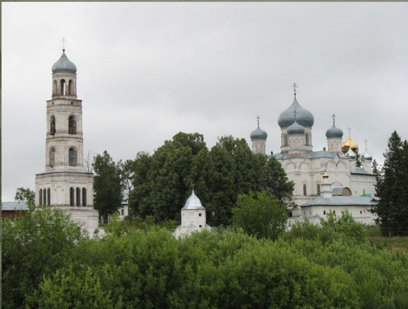
Фото 2006 г.

Слева-направо: колокольня и храмовый комплекс церквей Умиления Божией Матери, Николая Чудотворца и Покровского собора.