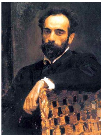
И. И. Левитан