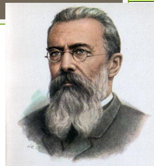
Н. А. Римский-Корсаков