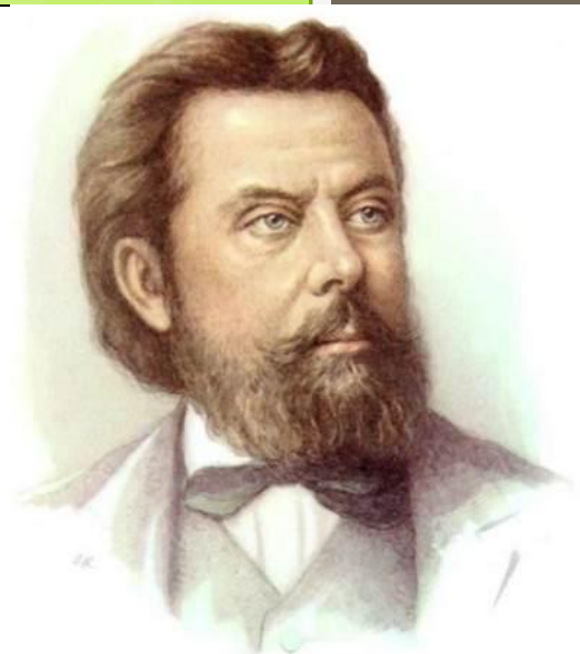
М. П. Мусоргский