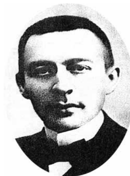
С. В. Рахманинов