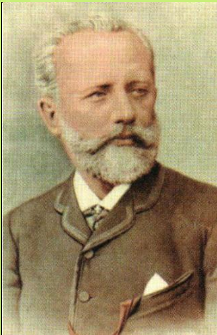
П. И. Чайковский