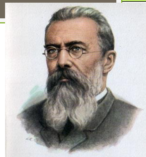
Н. А. Римский-Корсаков