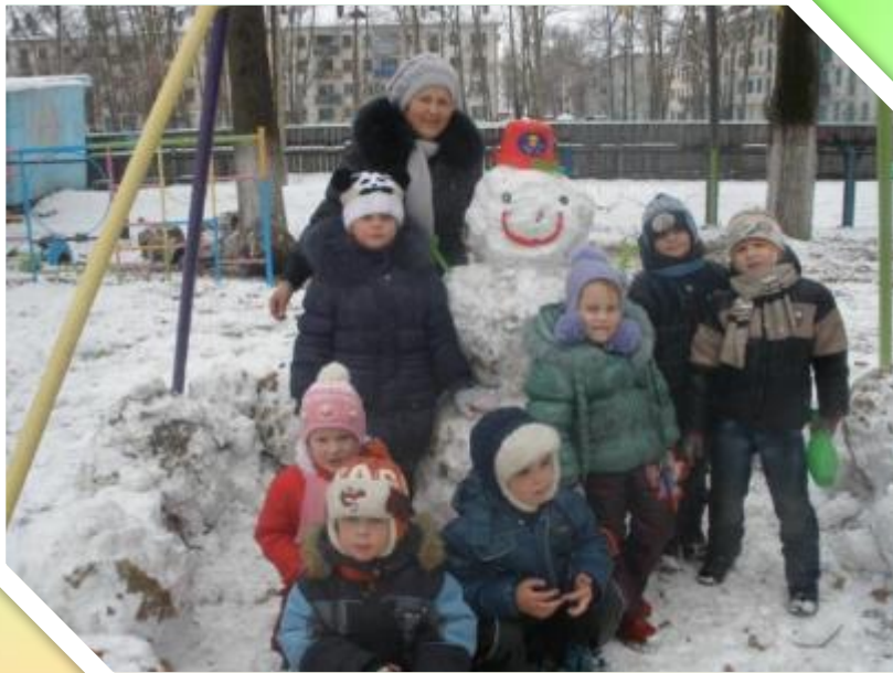
Наш Снеговик самый добрый и веселый!