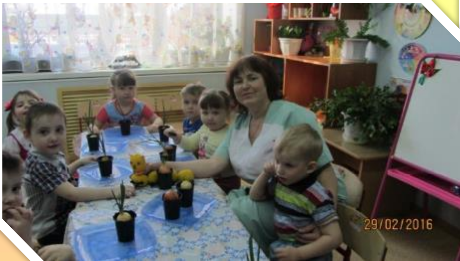
Экспериментируем и проводим опыты