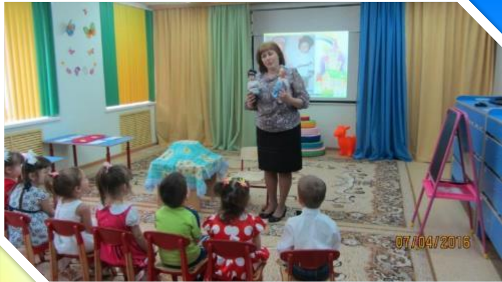
Открытый показ НОД по гендерному воспитанию «Ванечка и Манечка в гостях у ребят»