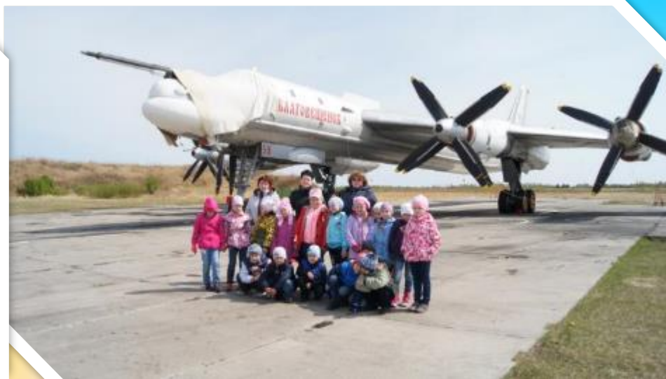
«Здесь служат наши папы» на экскурсии