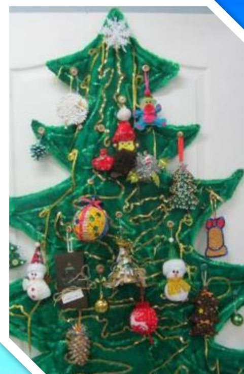
Конкурс «Новогодняя игрушка»