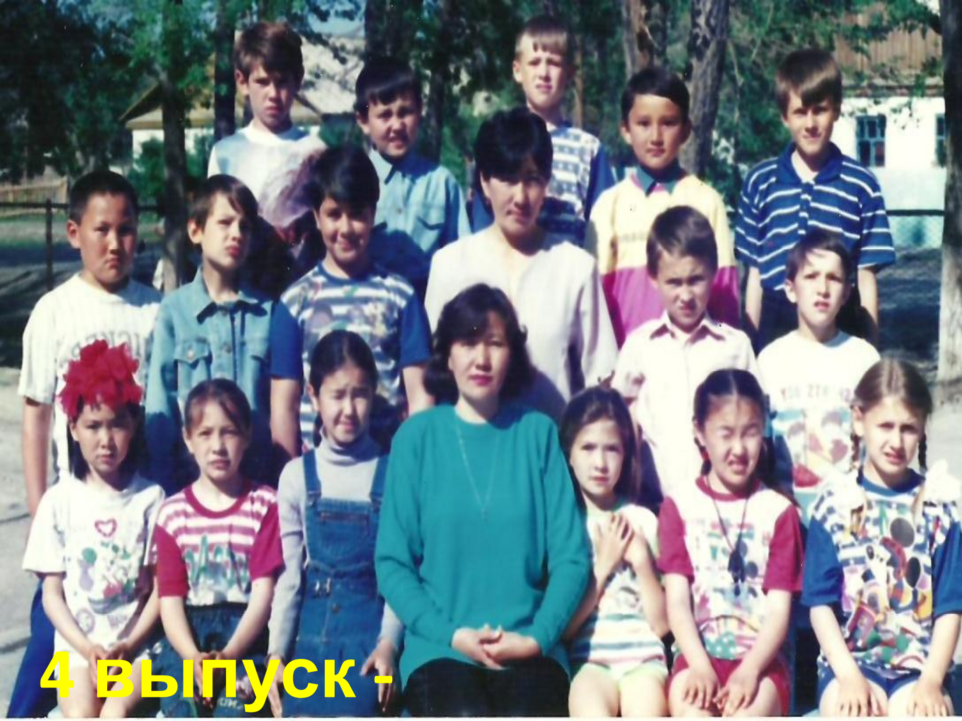
4 ВЫПУСК -