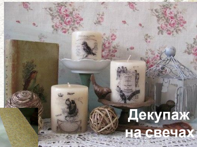
Декупаж на свечах

Разнообразие материалов, появляющихся в магазинах, позволяет декорировать любую поверхность: свечи, керамику, ткань, дерево, металл и прочее. А использование различных техник, таких как золочение, состаривание, кракле, художественный декупаж, объёмный декупаж (с применением модельной массы и других материалов) дают неограниченный простор.