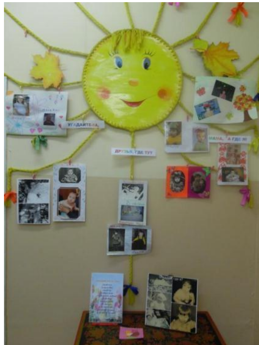
Фото-коллаж «Подскажите-ка друзья, где тут мама, а где я?». (Семейное творчество)