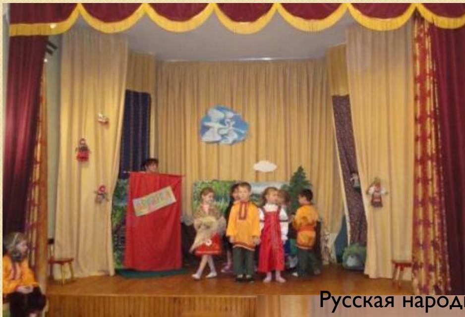
Русская народная сказка «По щучьему велению».