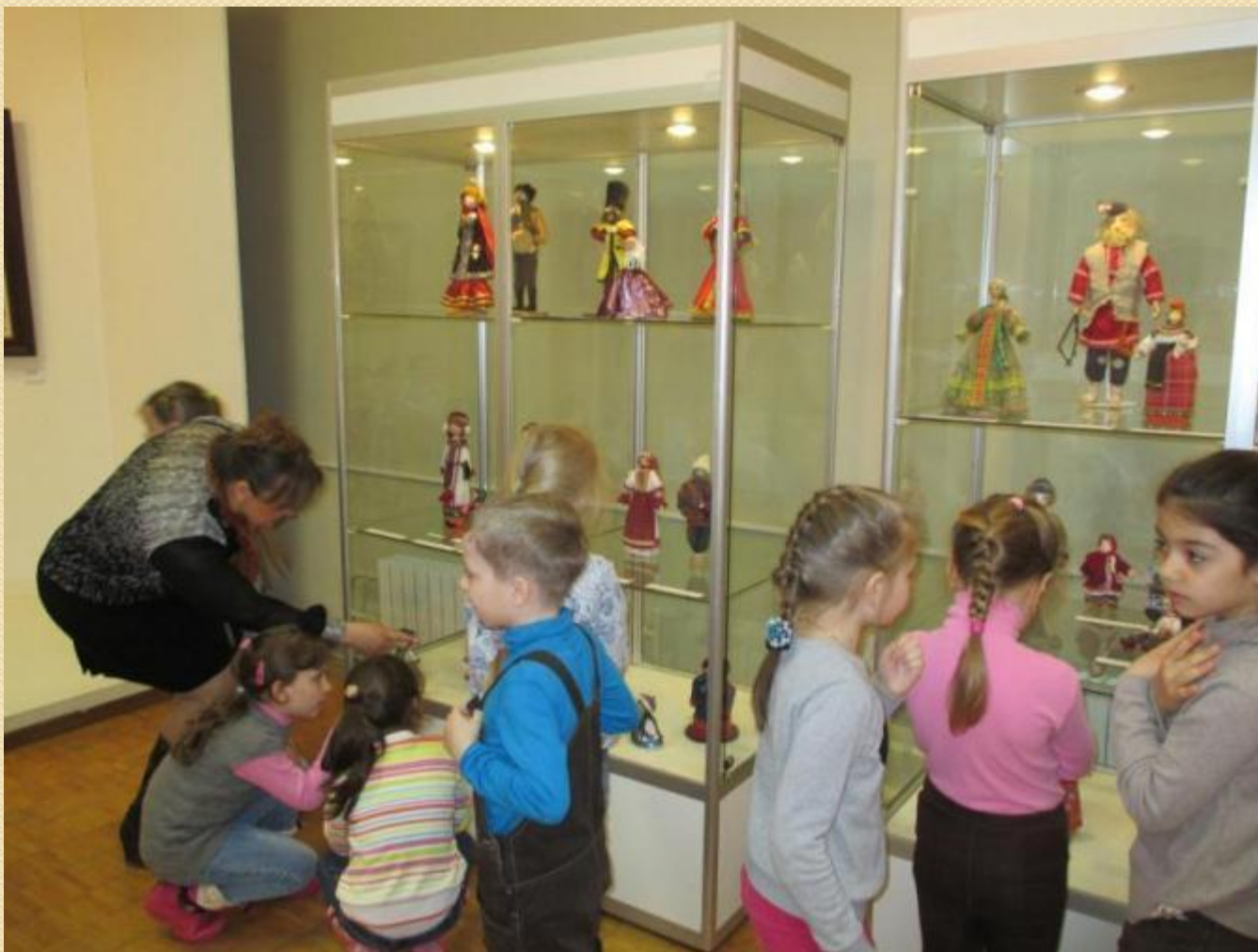
Музей. Знакомство с творчеством художника Н . Овсиенко «Тряпичные куклы».