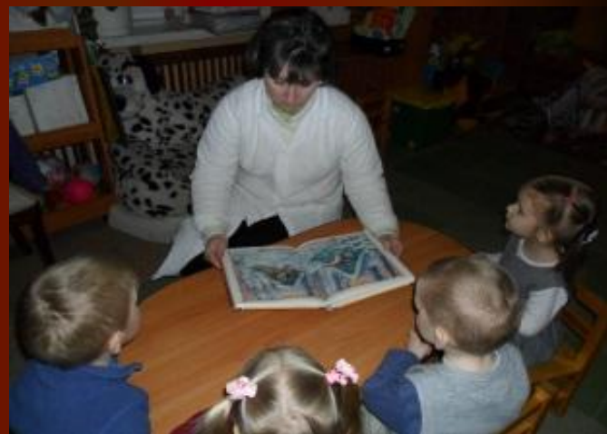
Чтение русской народной сказки «Заюшкина избушка»