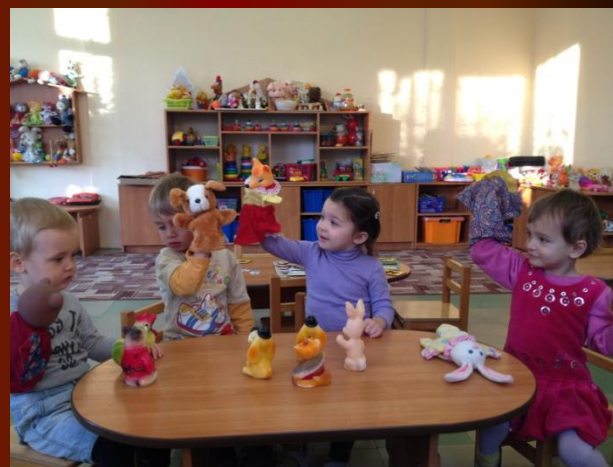
Рассматривание наглядного материала