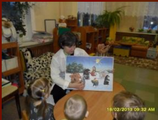
Плоскостной театр (панно)