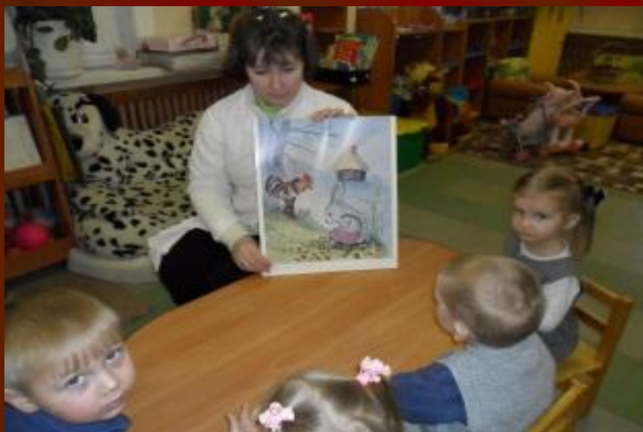
Рассматривание иллюстраций, картинок