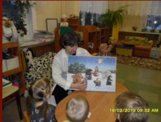
Плоскостной театр (панно)