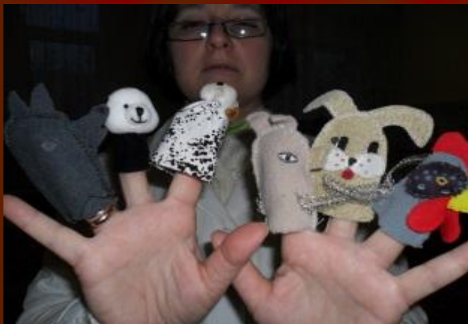
Знакомство с персонажами сказки