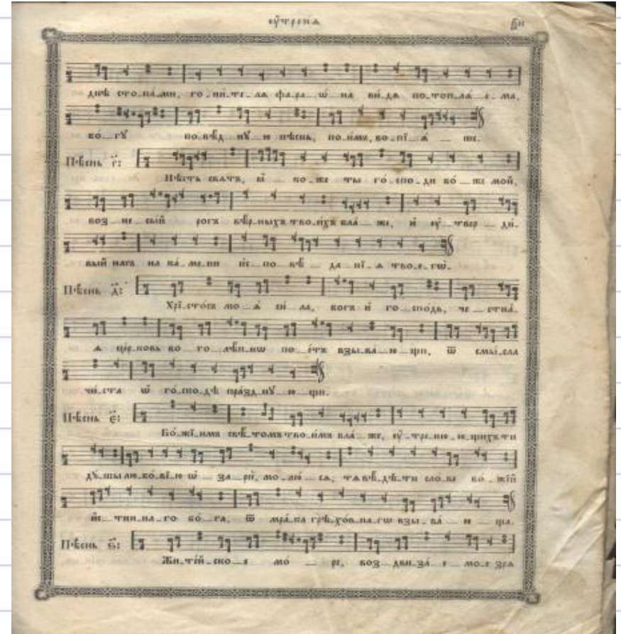
«Церковные песнопения»- 1900 год