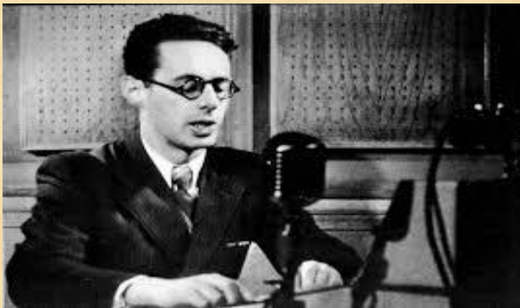
Юрий Борисович Левитан