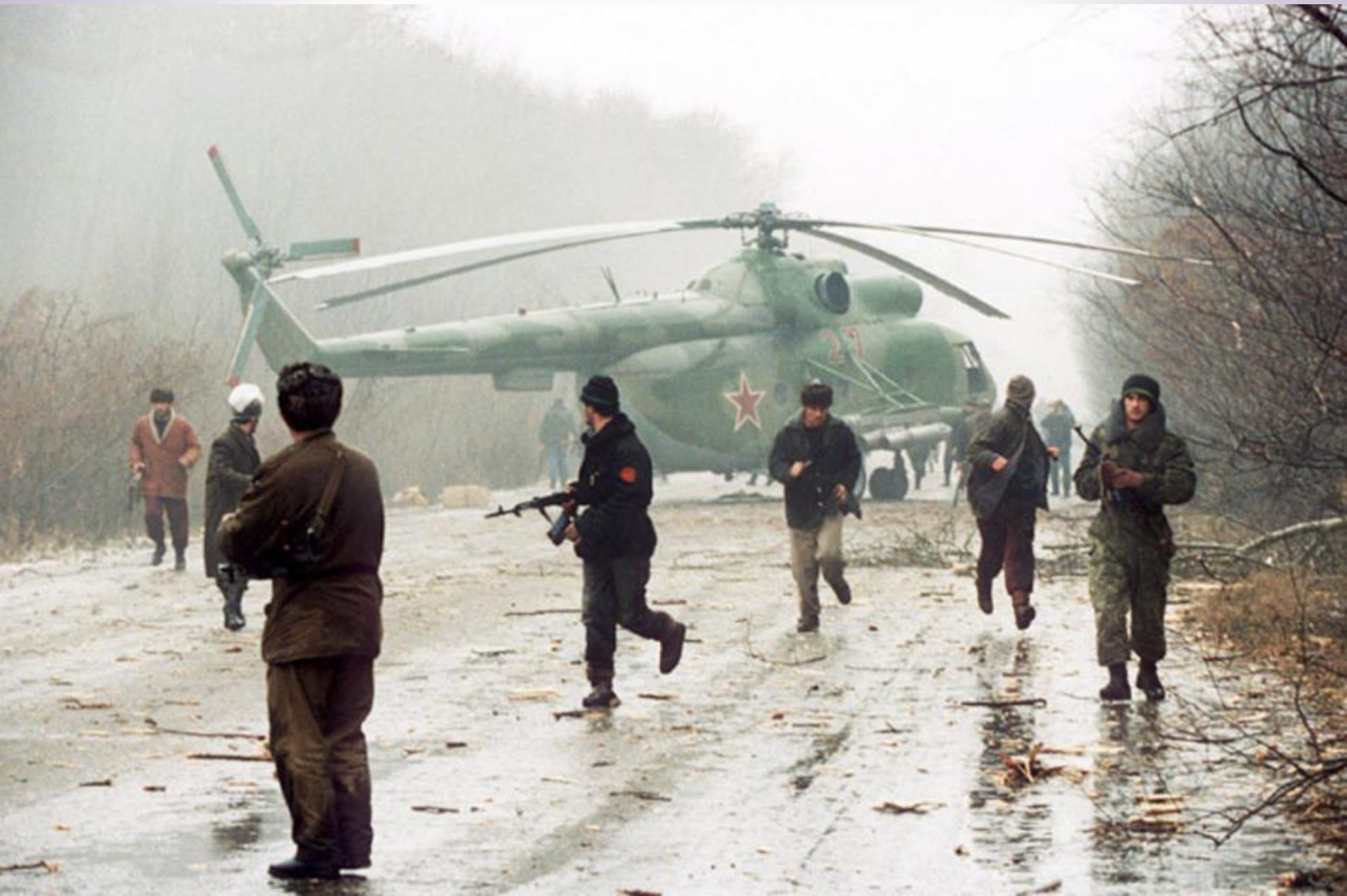
Российский вертолёт Ми-8, подбитый чеченцами рядом с Грозным. 1 декабря 1994 года