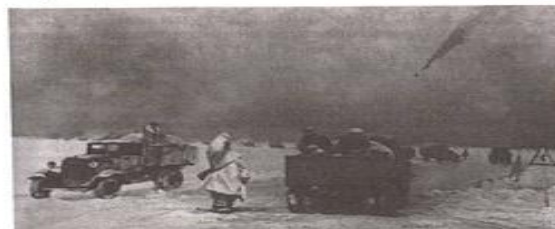
Дорога жизни через Ладожское озеро. 1942 г.

Несмотря на силу и внезапность гитлеровского нападения на СССР, Красная Армия на начальном этапе войны смогла не только выстоять, но и собрать силы для перехода в контрнаступление на стратегически важном московском направлении.