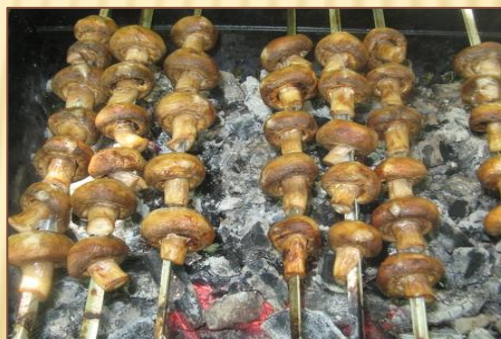
Шашлык из грибов