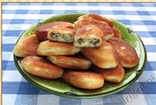
Пирожки с грибами