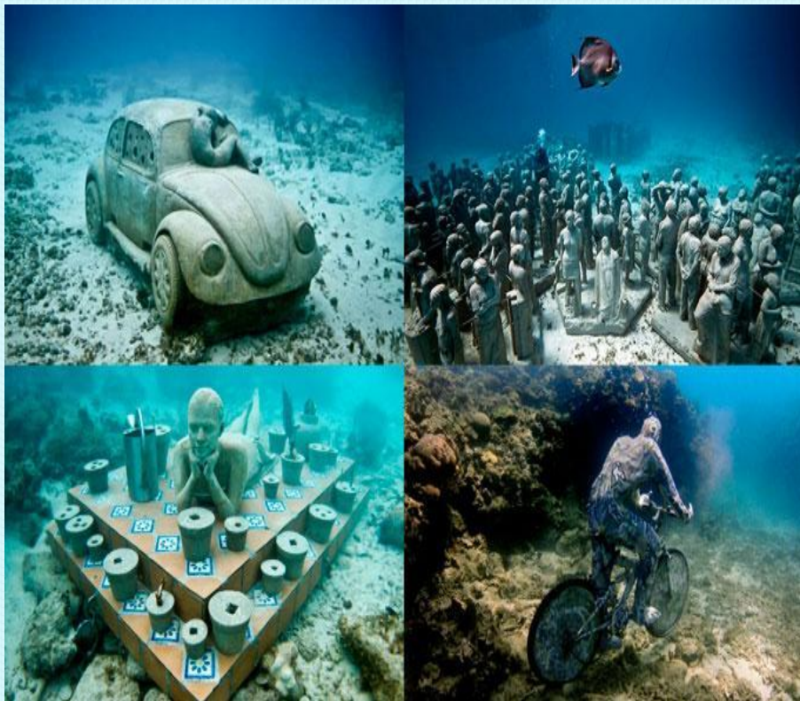
Подводный музей скульптур в Гренаде (Мексика).