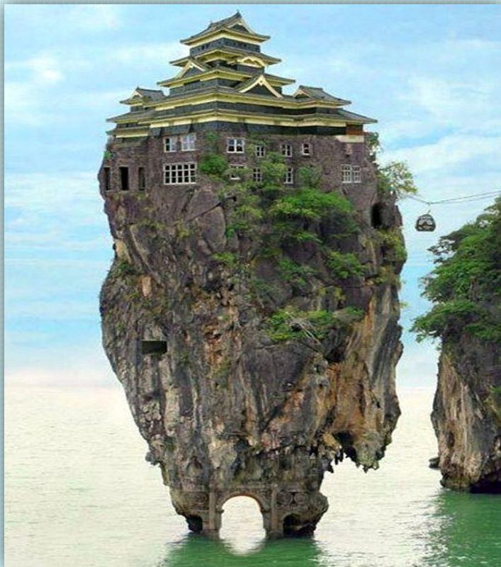
Храм на скале...