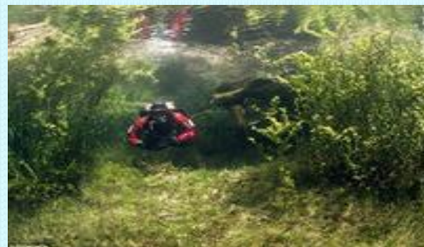
Подводный парк «Зеленое озеро» Канада.