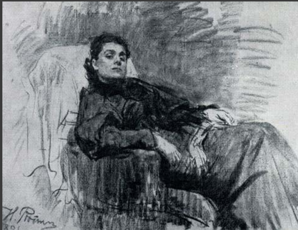
И. Репин. «Портрет Элеоноры Дузе». Уголь. 1891.