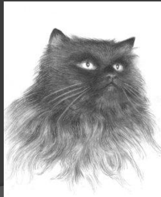
“Зарисовки” Бахытжан Бухарбаев