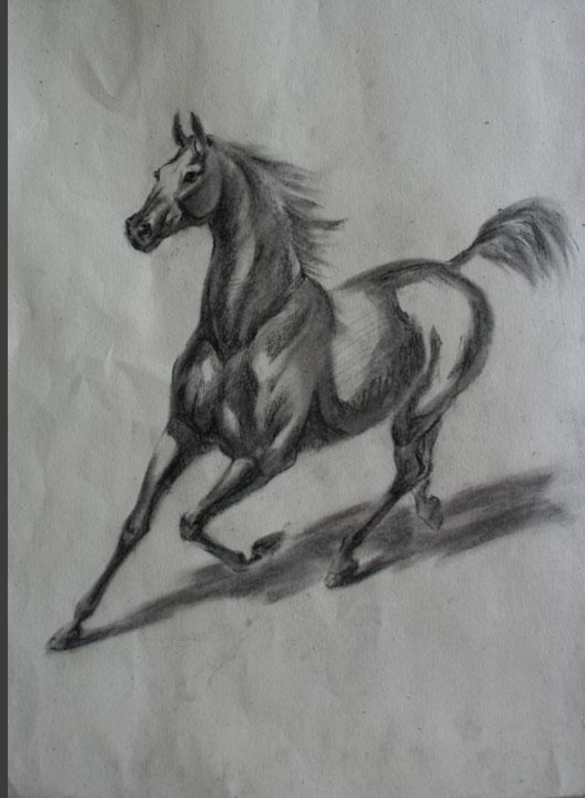
“Лошадь” Копытова Г.

Как материал для рисования уголь использовался еще древними греками. Они получали его из веток винограда или ивы, что очень напоминает материал, который используют современные художники. Уже в XV веке уголь служит идеальным средством для набросков фресок или картин. Впервые закреплять рисунки, выполненные углем, попытались в Венеции. Для этого в XVI веке в художественных мастерских использовали угольные палочки, предварительно пропитанные маслом из льна, отсюда название - масляный уголь. Рисунки, созданные таким углем, действительно прочны, но на них возможно появление масляных пятен.