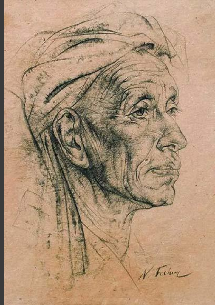
Н. Фешин. «Портрет стри́ка». Уголь. 2 четверть XX в.

При работе углем применяют и растушку, которая представляет собой туго скрученный валик из бумаги, кожи, замши с заостренным концом.