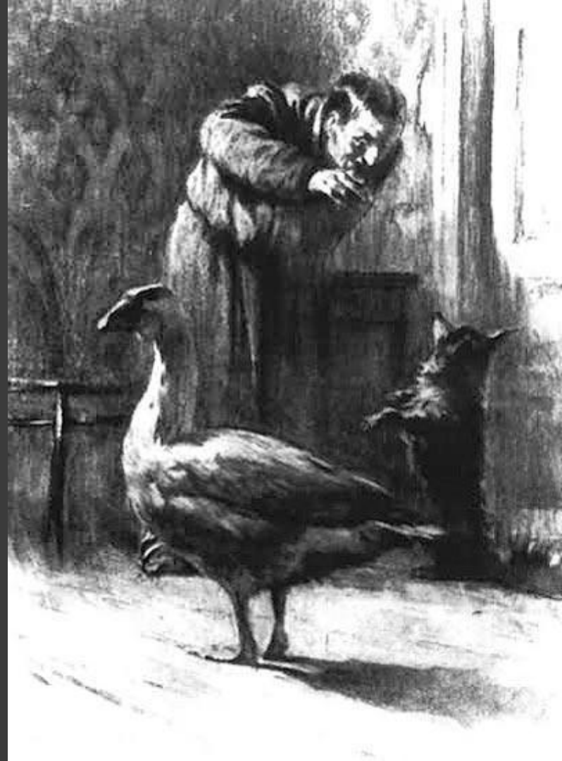
Д. Кардовский. «Иллюстрация к рассказу „Каштанка“». Уголь. 1911.

Если у вас нет возможности купить готовый материал, его можно приготовить самому в домашних условиях двумя способами: пучок прутьев или наколотых палочек обмазать глиной и положить в печь на горящие угли, или, поместив их в пустую консервную банку с крышкой, засыпать песком таким образом, чтобы будущие угольки не касались стенок и дна банки. Через некоторое время вы получите угольки различной формы и величины.