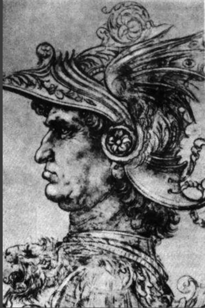
Профильный портрет воина, выполненный Леонардо да Винчи