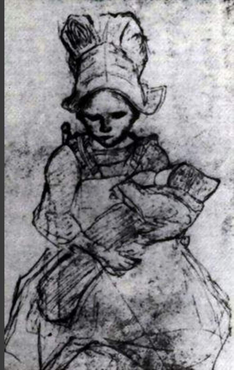
Камилл Коро "Крестьянская девочка Эме Ренуаф с ребенком".