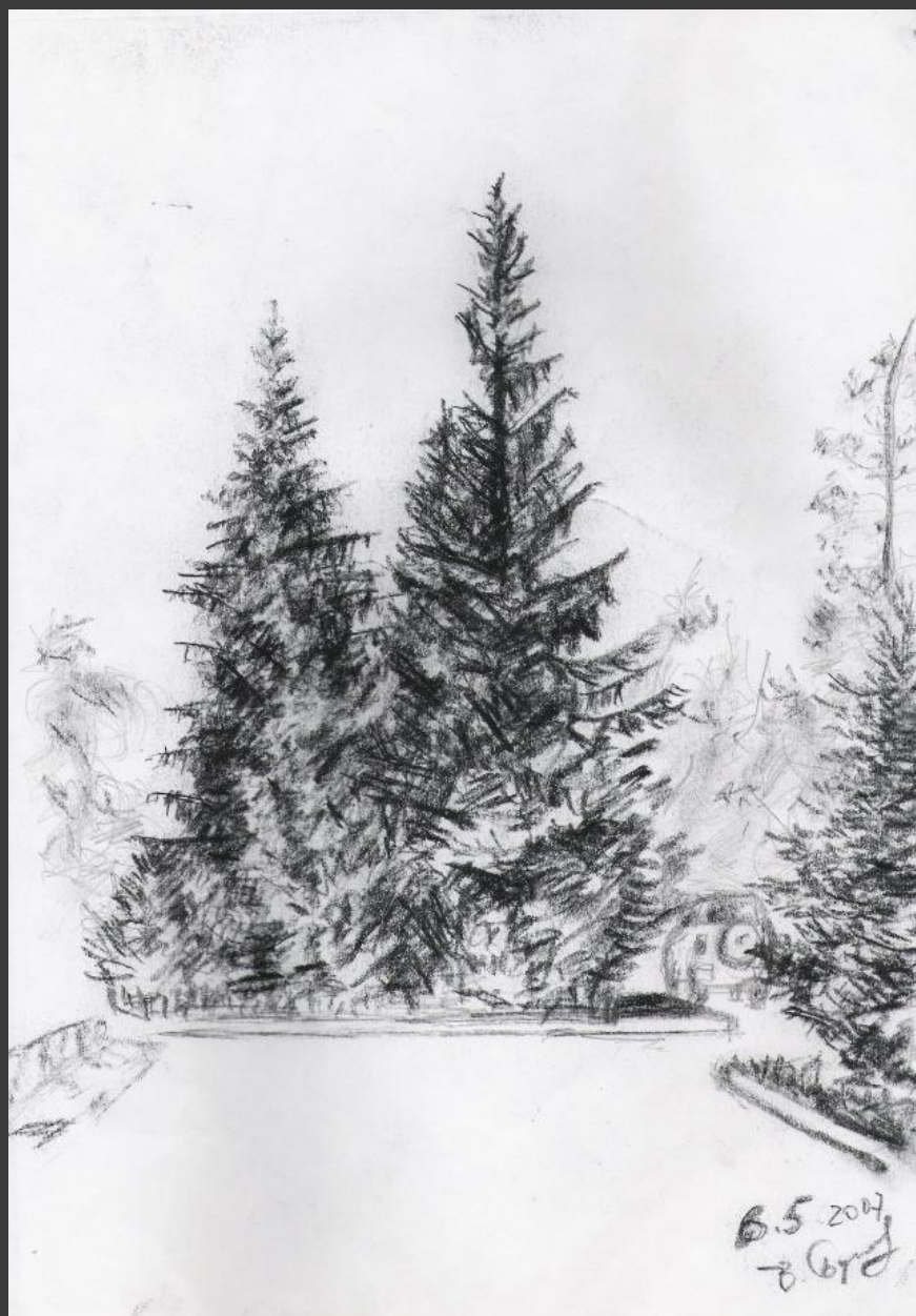
“Зарисовки” Бахытжан Бухарбаев