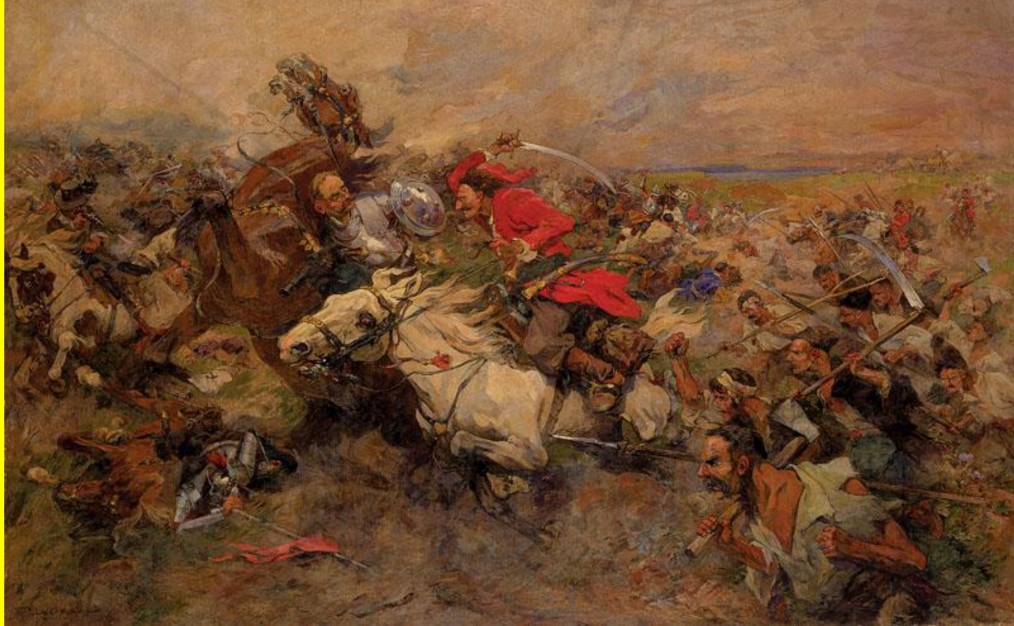
«Бій Максима Кривоноса з Яремою Вишневецьким», 1934р.