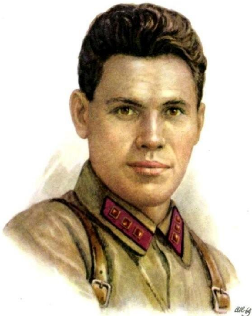
Герой Советского Союза ВАСИЛИЙ ГЕОРГИЕВИЧ КЛОЧКОВ