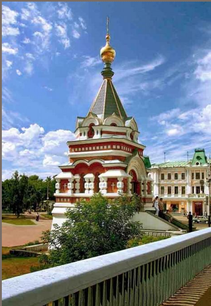
Серафимо- Алексеевская часовня