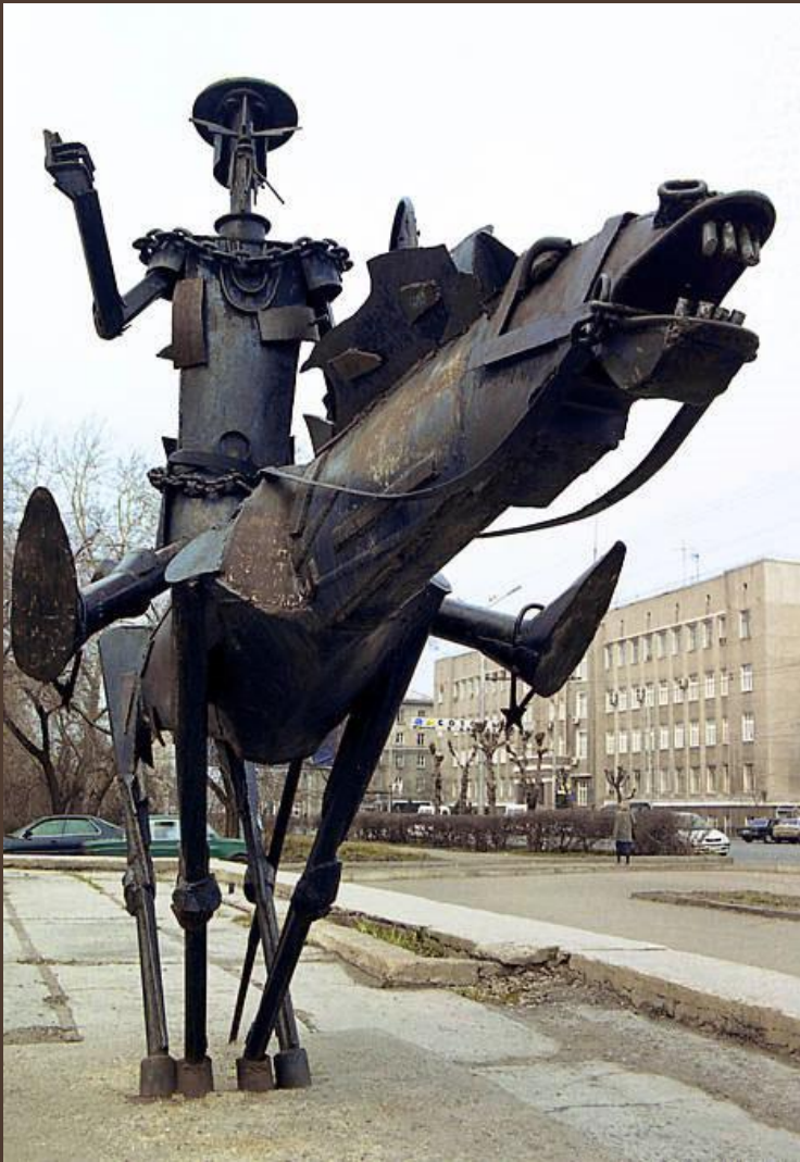
«Дон Кихот». Скульптура А. Н. Капралова