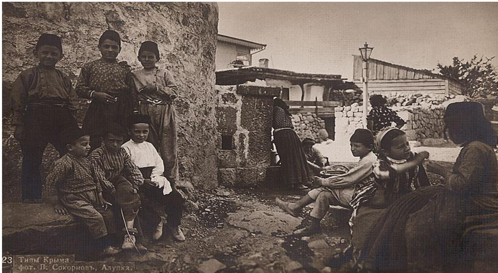
23 Типы Крыма

Умер Абдулла Огълу(Ашыкъ Умер) 1621 сенеси Кезлев шеэринде, Абдулла Кендже аилесинде дуньягъа келе.Яшы еткен сонъ маале мектебине къатнап элифбе ве башка агъыз эдебиятыны огрене.