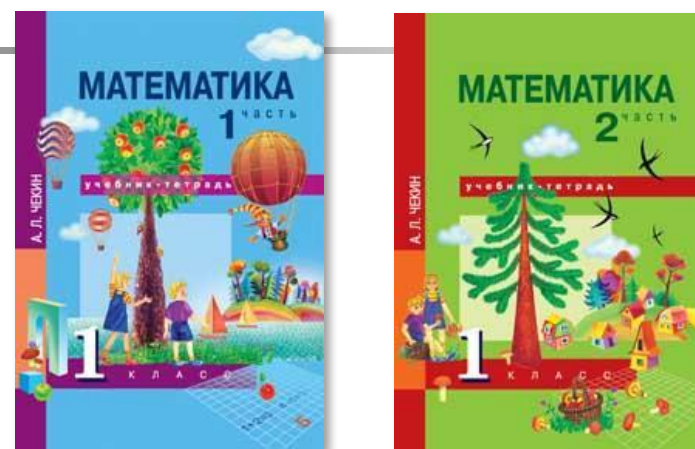
Учебник в двух частях