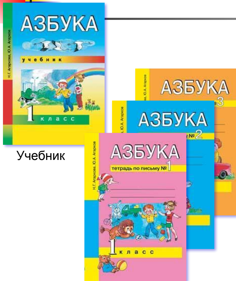
Прописи № 1, 2, 3