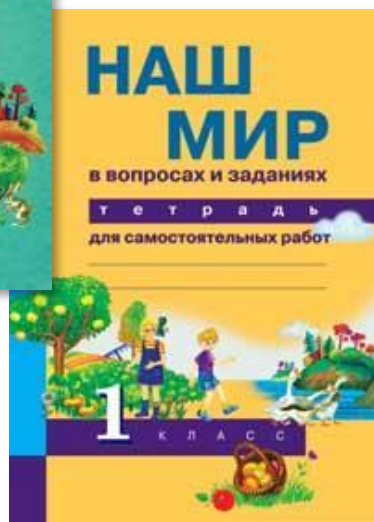
Тетрадь для самостоятельных работ