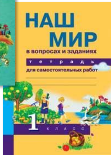
Тетрадь для самостоятельных работ