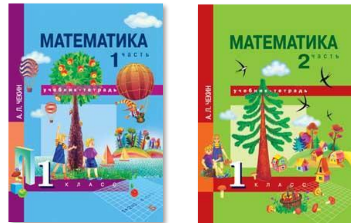
Учебник в двух частях