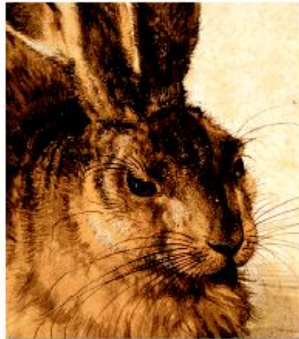
Леонард Дюрер. Утенок (фрагмент)