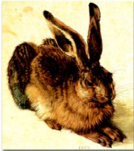
Леонард Дюрер. Утенок.