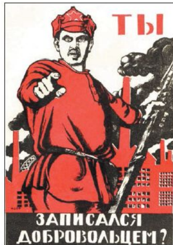
Белогвардейский и советский агитационные плакаты времён Гражданской войны