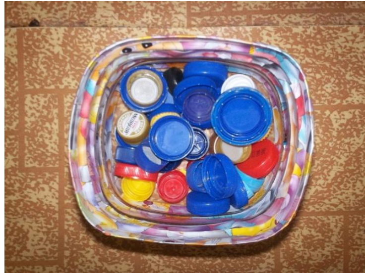
мастер – класс «Изготовление пособий для пальчиковых игр», «Аквариумы с крышечками и пальчиковые бассейны»