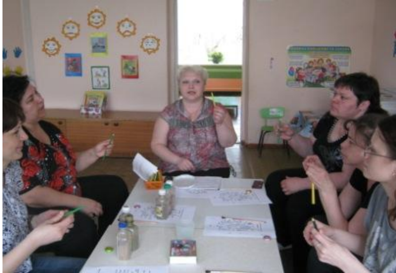
семинары: «Упражнения для пальчиков Марии Монтессори», «Мелкая моторика в психофизическом развитии детей»