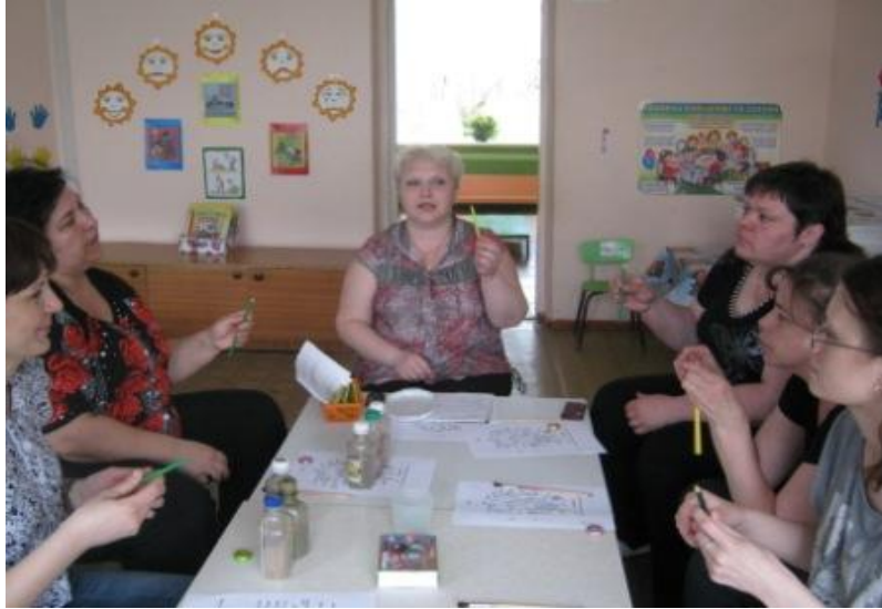
семинары: «Упражнения для пальчиков Марии Монтессори», «Мелкая моторика в психофизическом развитии детей»