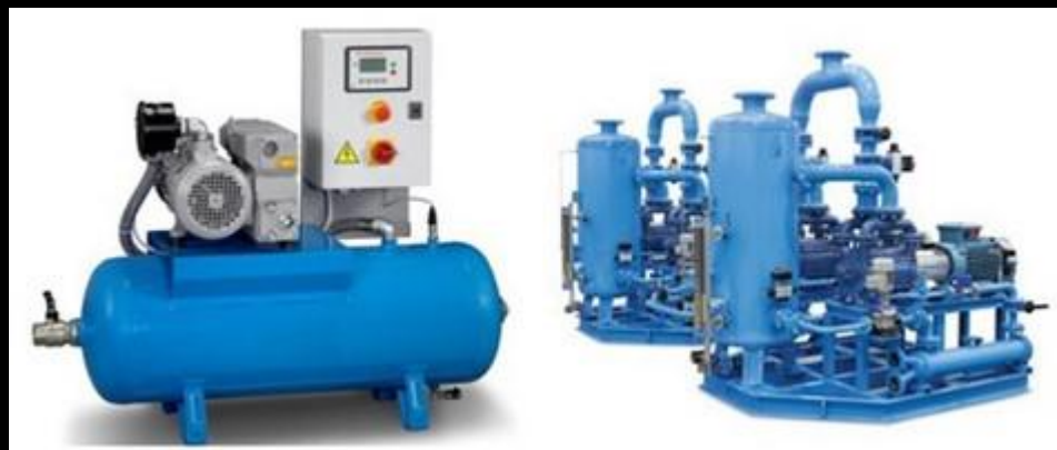
Рис. 1. Вакуумные системы