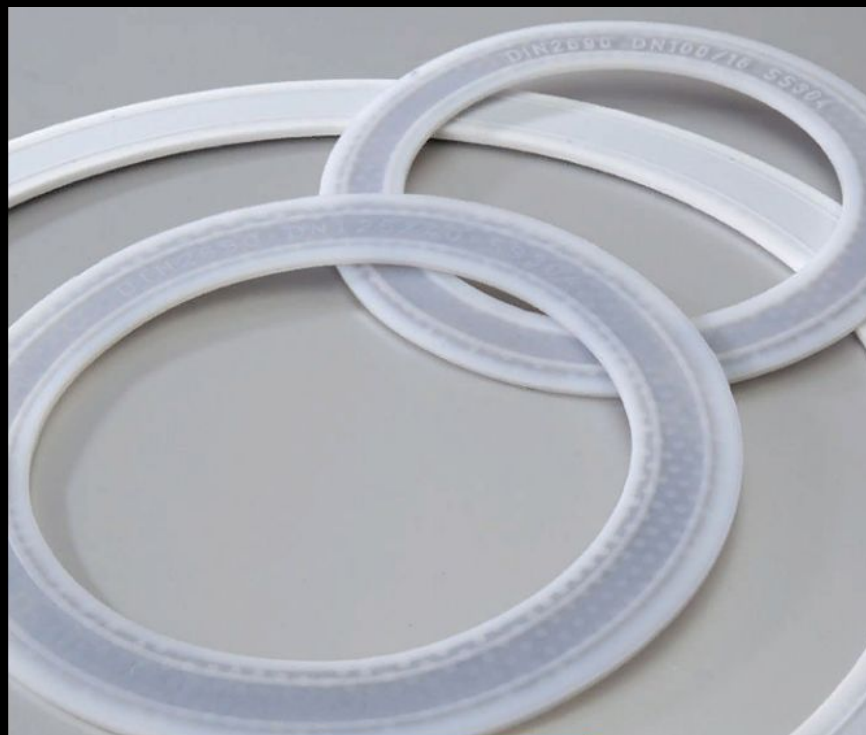
Рис. 11. Кольцевые трубчатые прокладки, изготовленные из нержавеющей стали