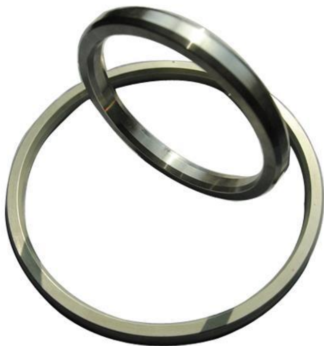
Рис. 8. Виды металлических прокладок