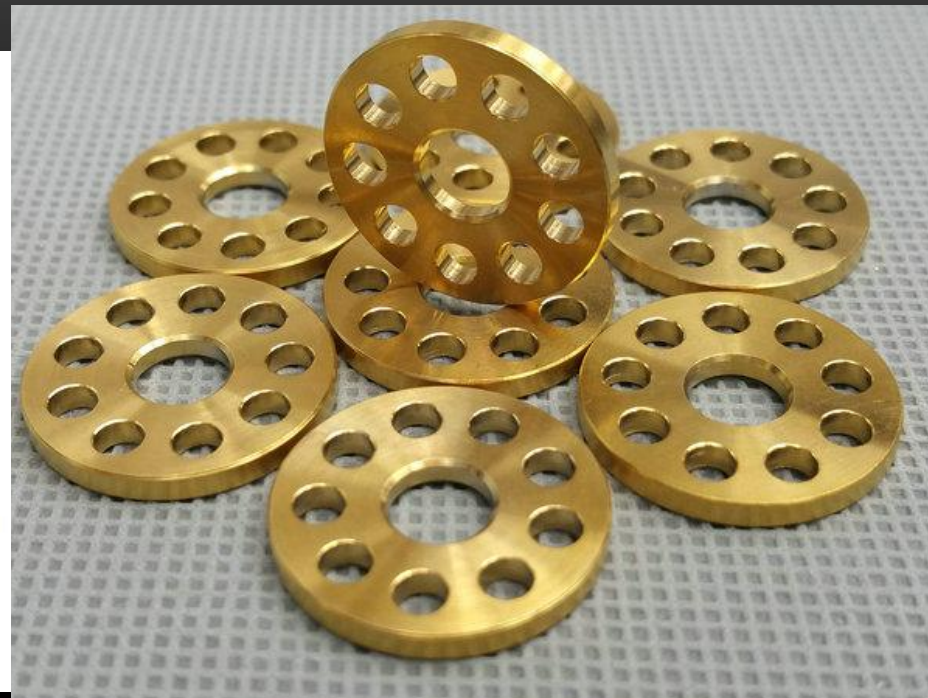
Рис. 9. Золотые прокладки