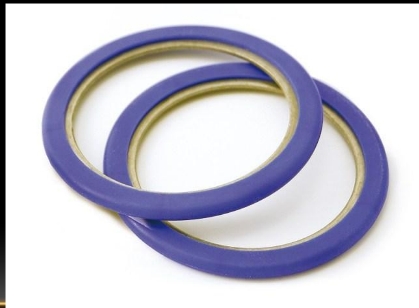
Рис. 7. Viton Extreme