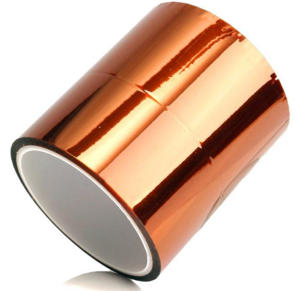
Рис. 5. Каптон Н

Стабилен в широком диапазоне температур от -273 до +400 °C