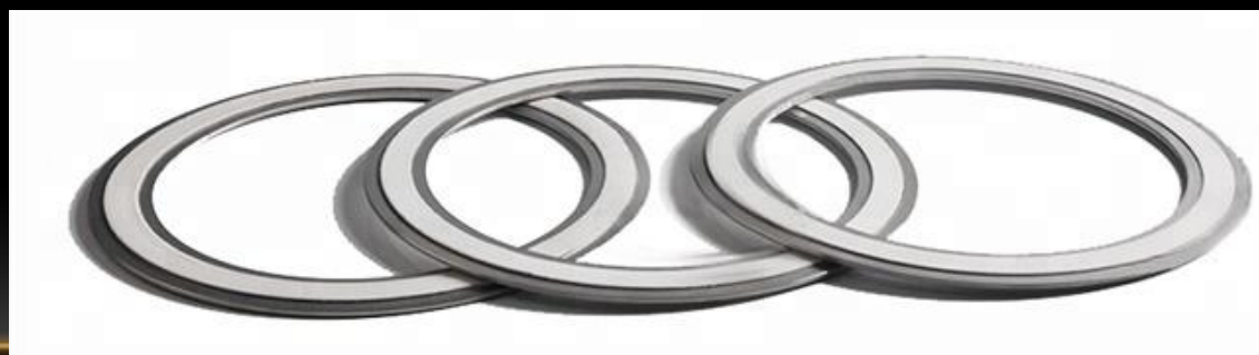
Рис. 10. Монель