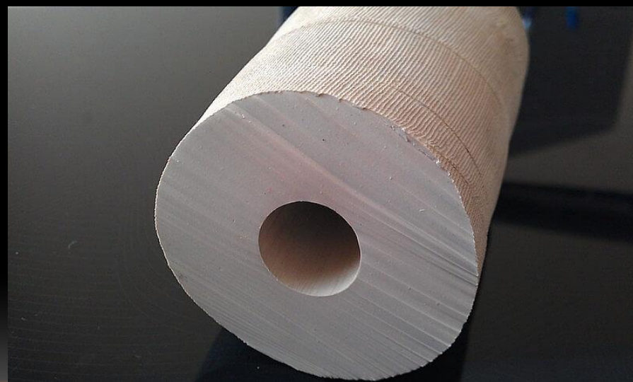
Рис. 2. Виды вакуумных уплотнителей