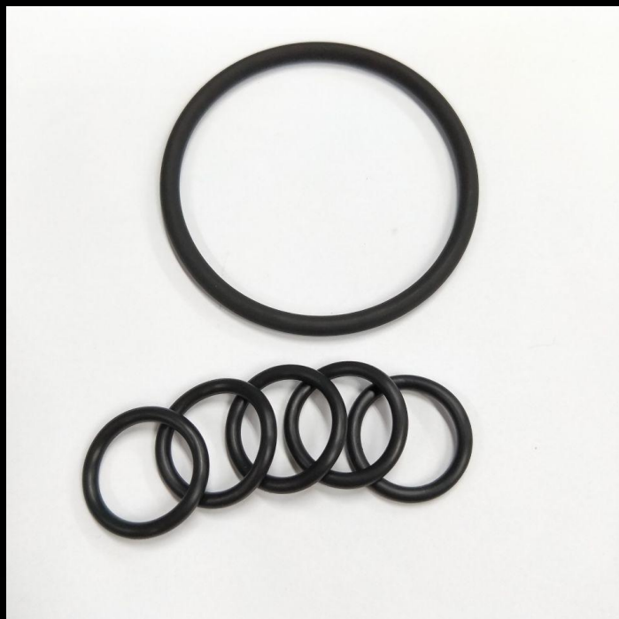
Рис. 6. Перфторэластомер Kalrez

Его преимущества проявляются при использовании Калреза в экстремальных температурных режимах и при эксплуатации оборудования в условиях агрессивных сред: термостойкость материала – до +327°C, а также он противостоит воздействию более чем 1800 химически активных веществ.