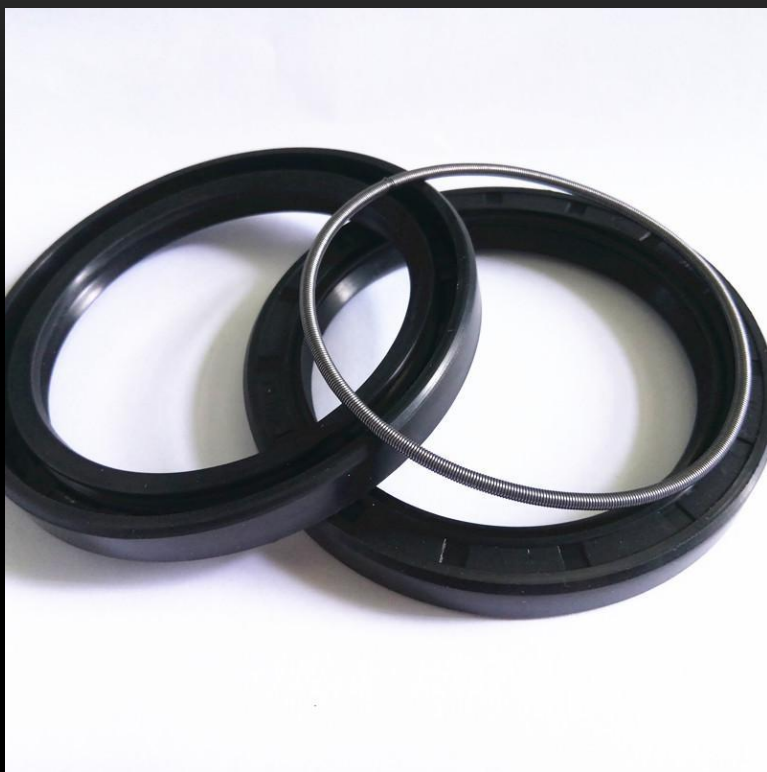
Рис. 4. Viton тип А

Viton тип А - старейший и наиболее распространенный фторэластомер общего применения. Как правило, содержит 66% фтора. Главными свойствами материала являются: