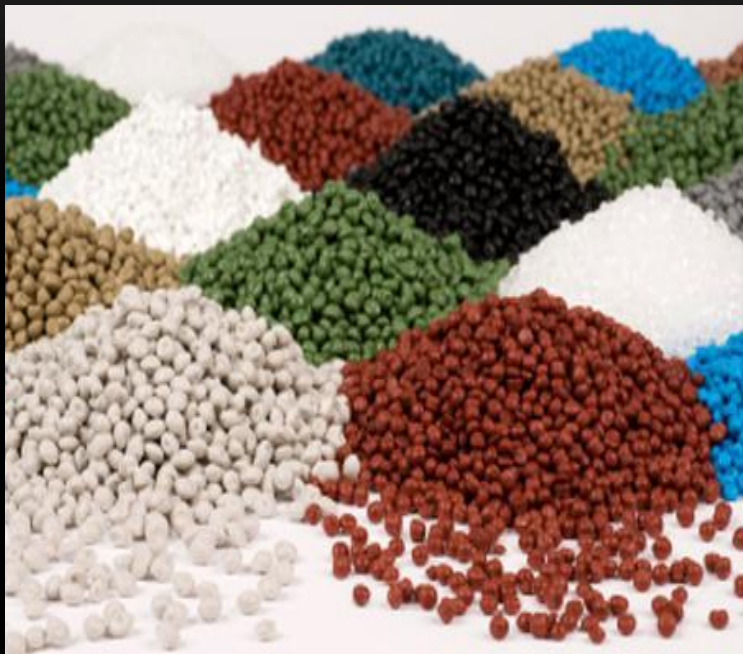
Рис. 3. Изопреновый каучук