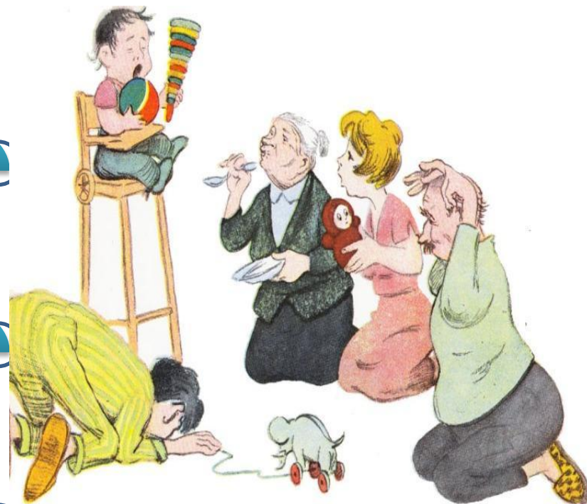
Рисунок Е. ГУРОВА.

Если Вы решили всерьез бороться с капризами, то прежде всего, надо начать с себя!