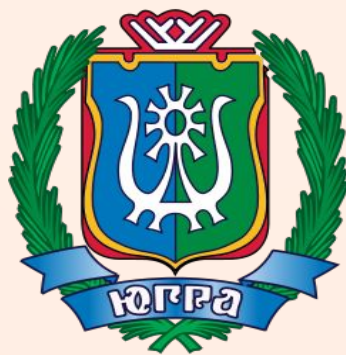
Ханты- Мансийский АО