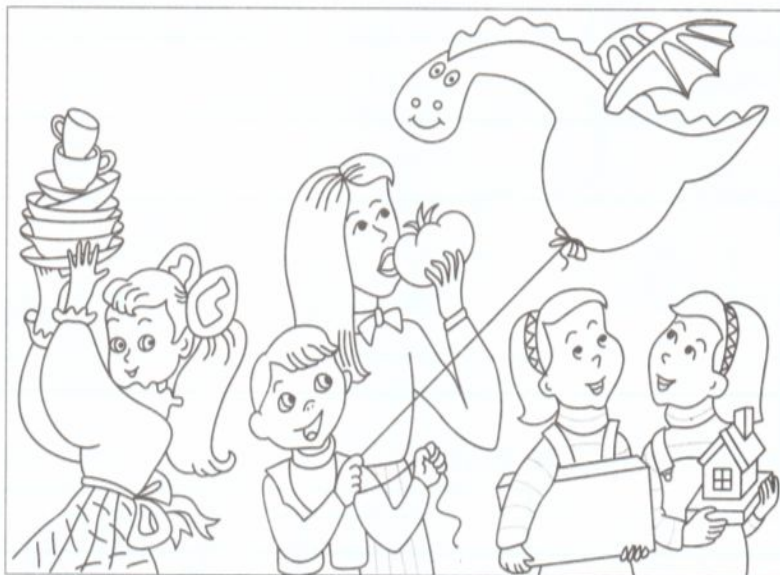
Рада Раиса Рудик Лада Лида