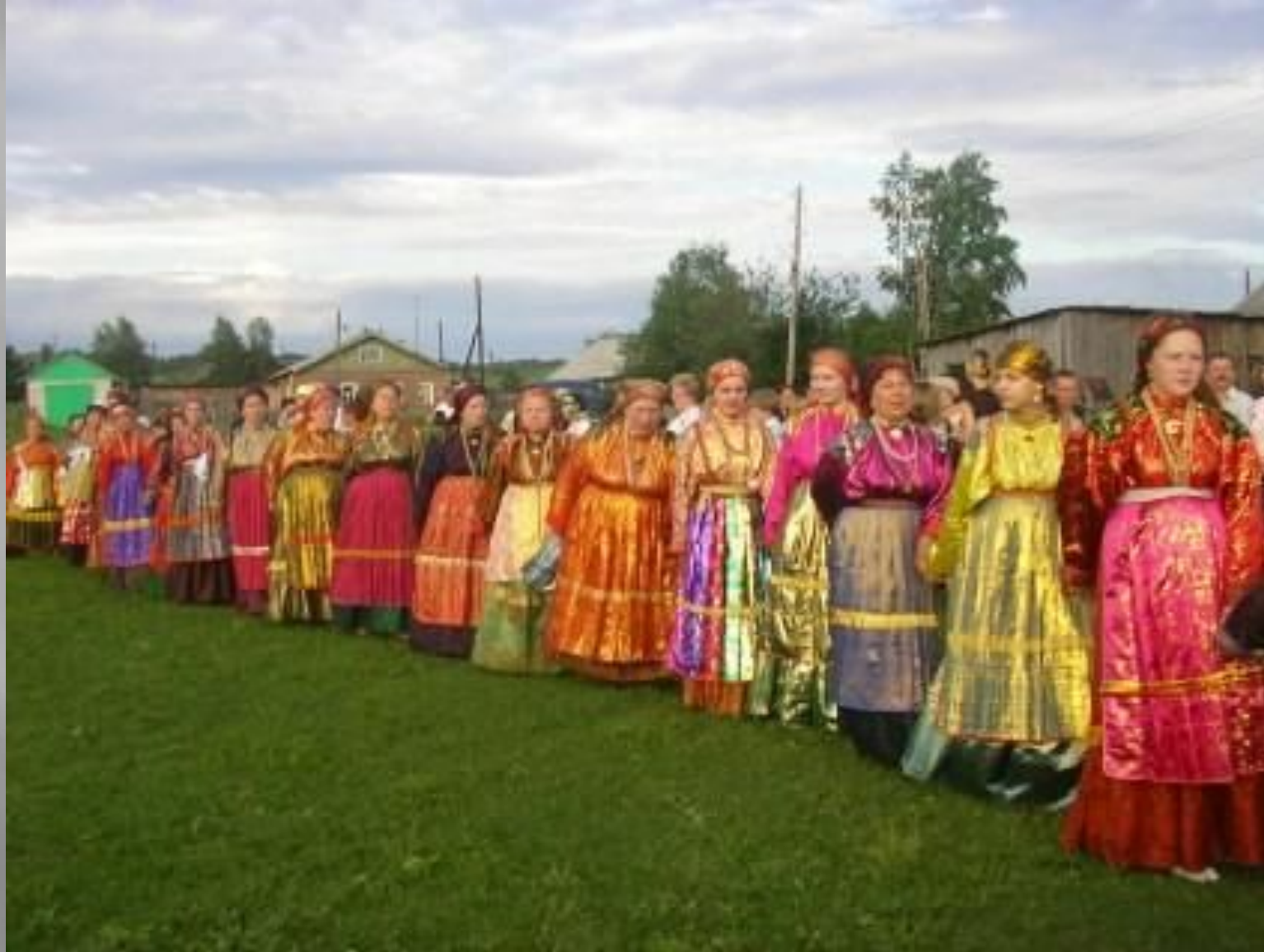
народный праздник «Горка»