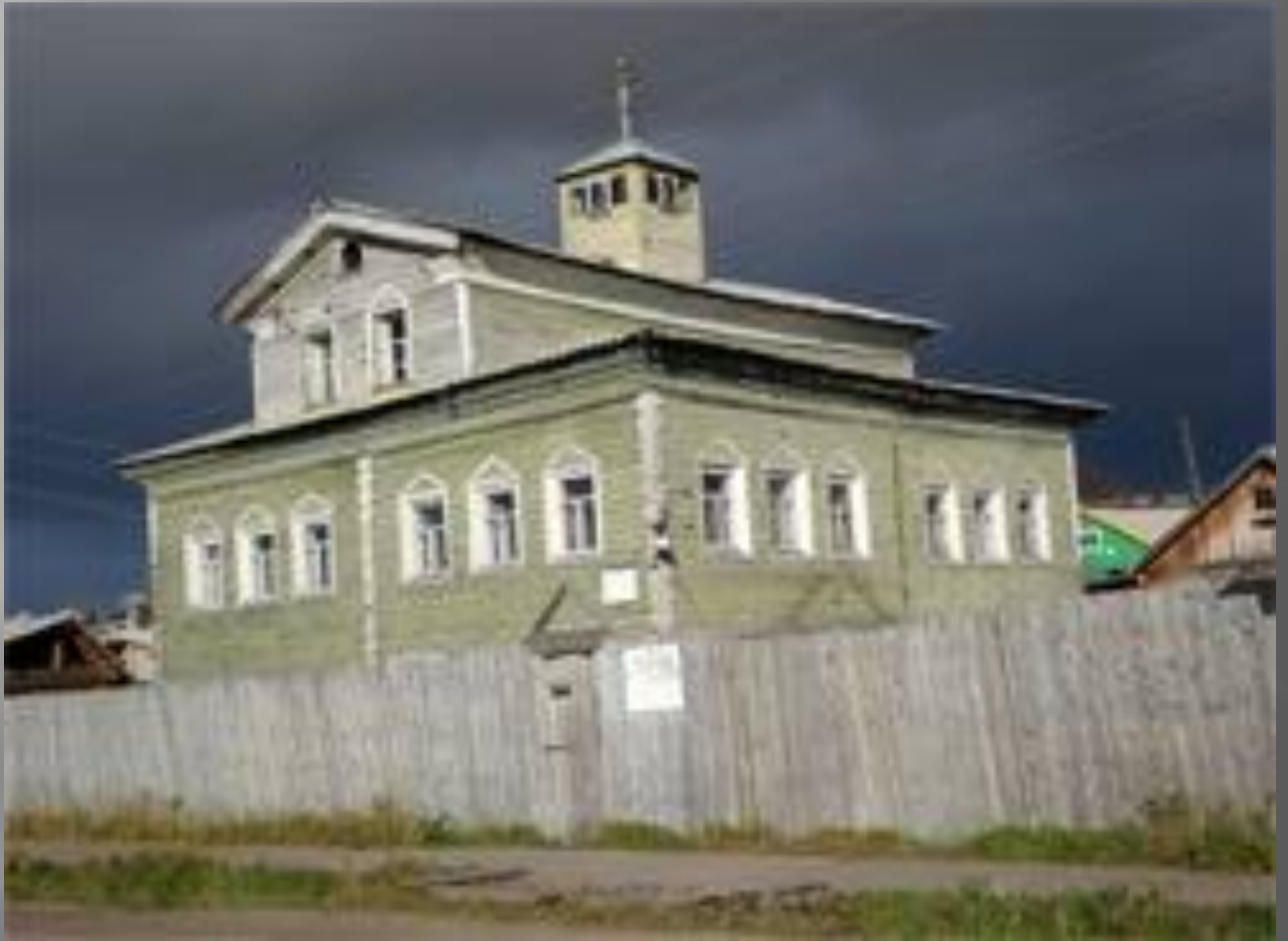
Староверческий моельный дом