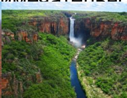
Национальный парк «Какаду»