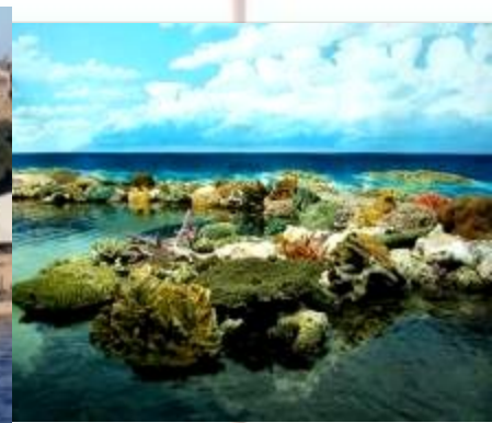
Большой Барьерный Риф