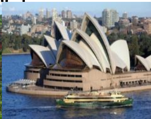
Сиднейский Оперный театр