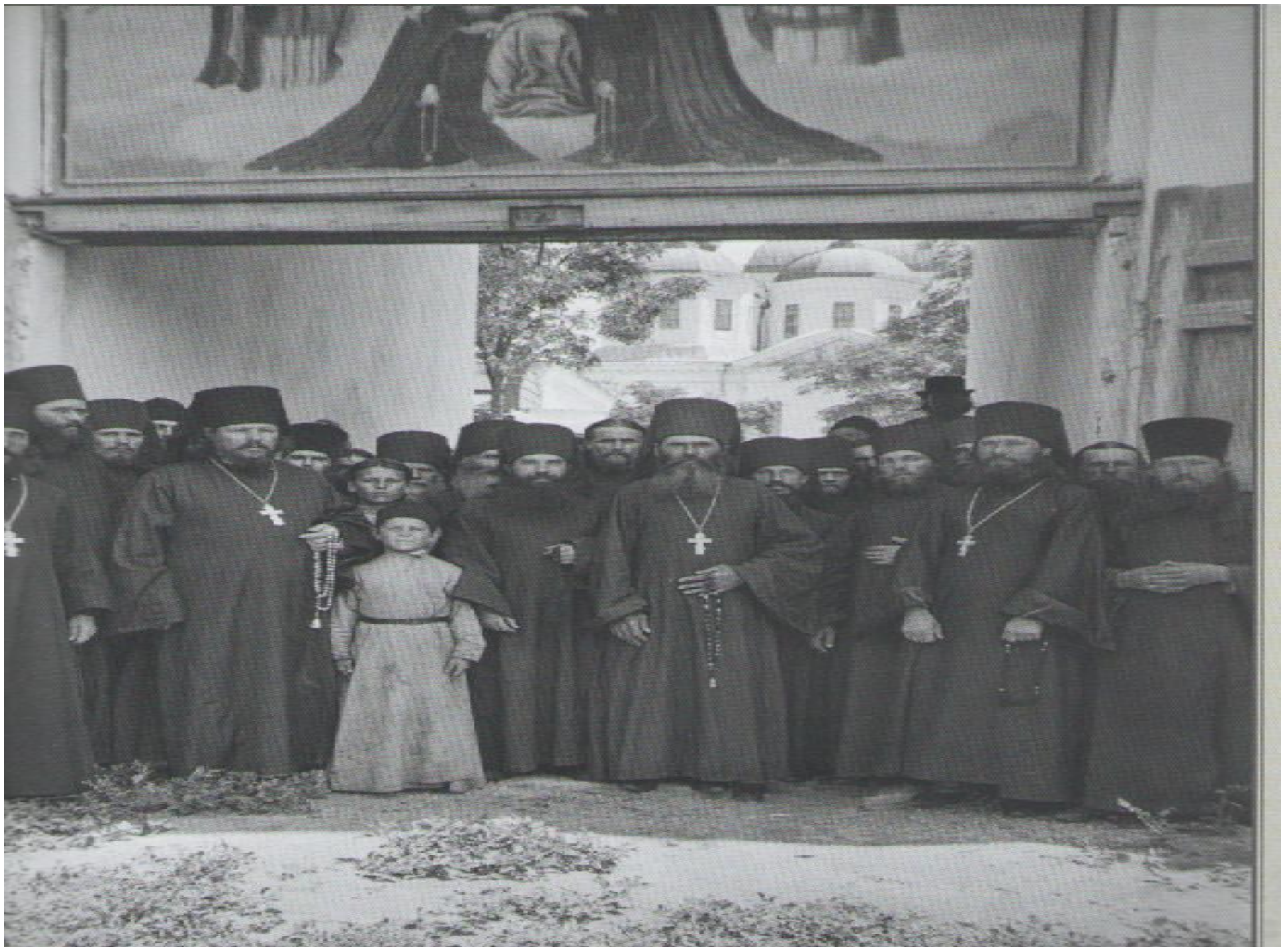
МОНАХИ У ВОРОТ ,ВЕДУЩИХ К СОБОРНОМУ ХРАМУ