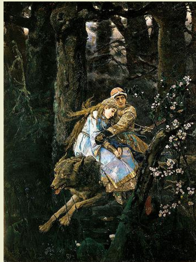
«Иван Царевич на Сером Волке» 1879