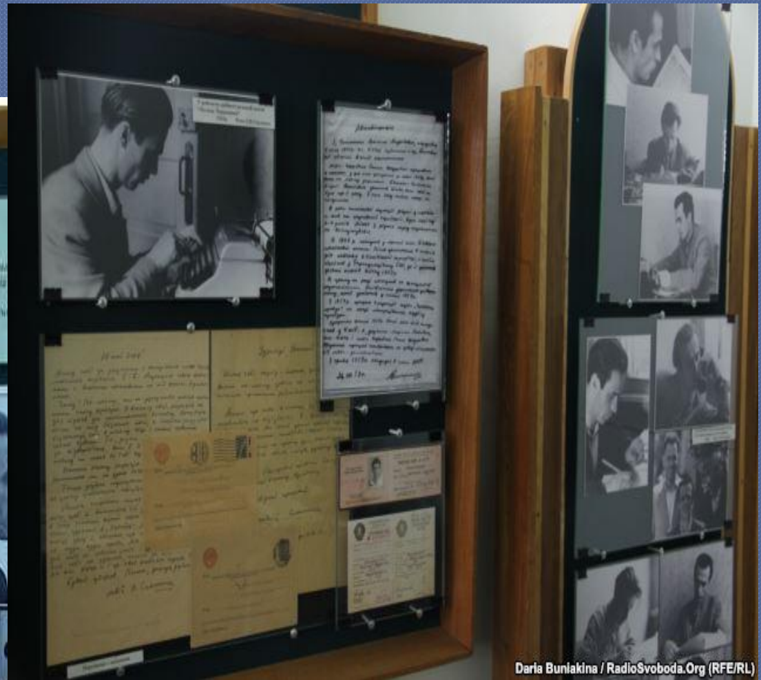
Daria Buniakina / RadioSvoboda.Org (RFE/RL)