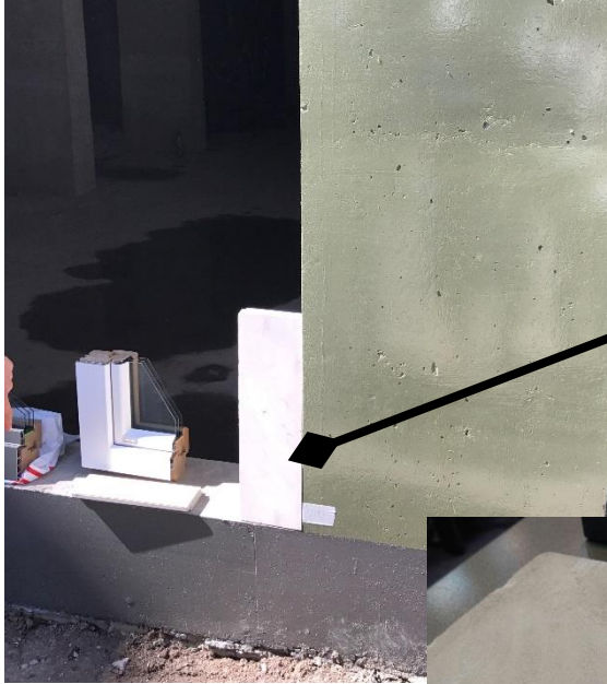
камень RAL 9002.