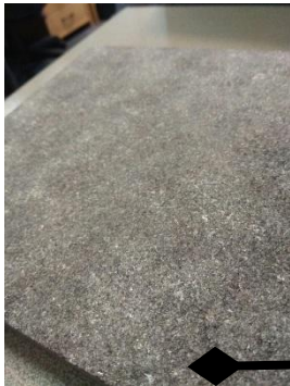
Гранит RAL 7039