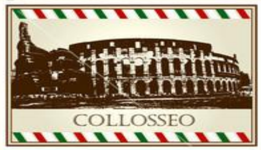
Vector set of Italian symbols