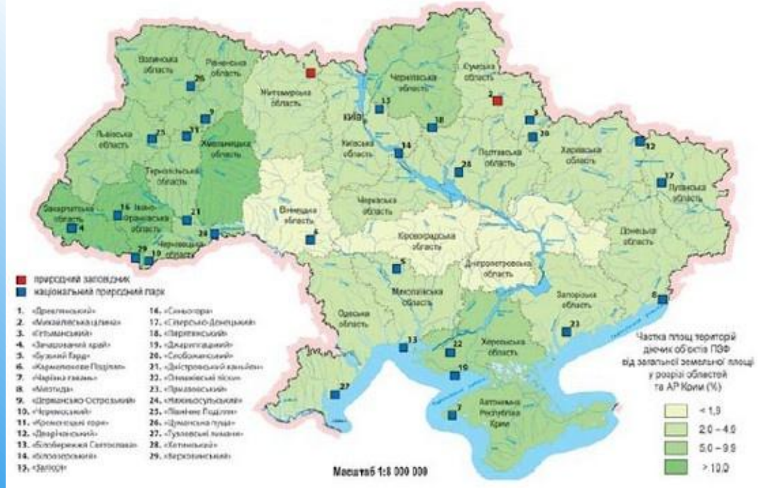
КАРТА ОБ'ЄКТІВ ПРИРОДНО-ЗАПОВІДНОГО ФОНДУ (ПЗФ) УКРАЇНИ (природні заповідники та національні природні парки), СТВОРЕНИХ У 2008-2010 РОКАХ

Створення цілісної мережі заповідних територій різного рангу і призначення як елемента Європейської екомережі. Збільшення площ наявного заповідного фонду, посилення охорони природних комплексів і впорядкування територій заповідності.