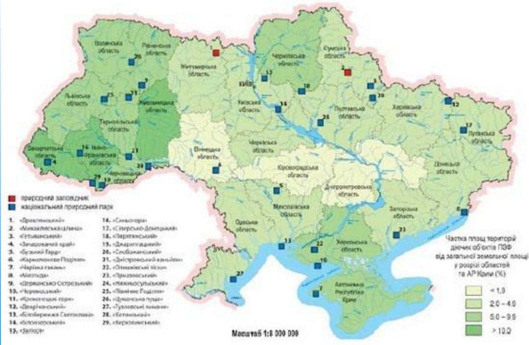
КАРТА ОБ'ЄКТІВ ПРИРОДНО-ЗАПОВІДНОГО ФОНДУ (ПЗФ) УКРАЇНИ (природні заповідники та національні природні парки), СТВОРЕНИХ У 2008-2010 РОКАХ

Створення цілісної мережі заповідних територій різного рангу і призначення як елемента Європейської екомережі. Збільшення площ наявного заповідного фонду, посилення охорони природних комплексів і впорядкування територій заповідності.