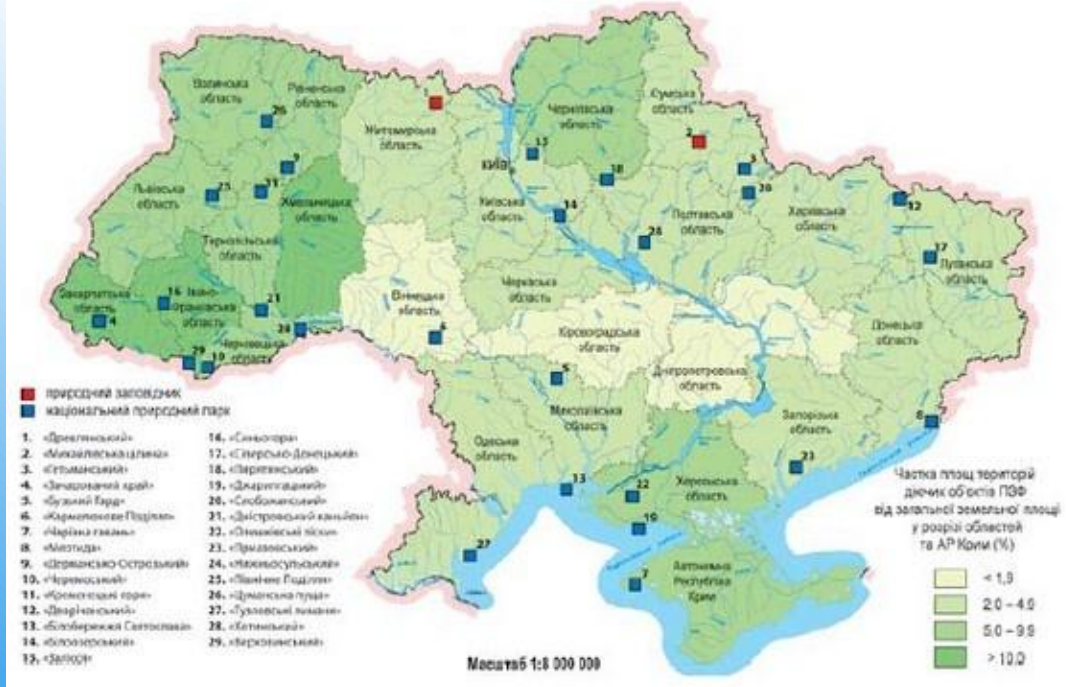
КАРТА ОБ'ЄКТІВ ПРИРОДНО-ЗАПОВІДНОГО ФОНДУ (ПЗФ) УКРАЇНИ (природні заповідники та національні природні парки), СТВОРЕНИХ У 2008-2010 РОКАХ

Створення цілісної мережі заповідних територій різного рангу і призначення як елемента Європейської екомережі. Збільшення площ наявного заповідного фонду, посилення охорони природних комплексів і впорядкування територій заповідності.