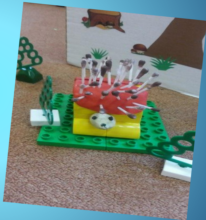
Под ёлкой , в норке ёж живет..