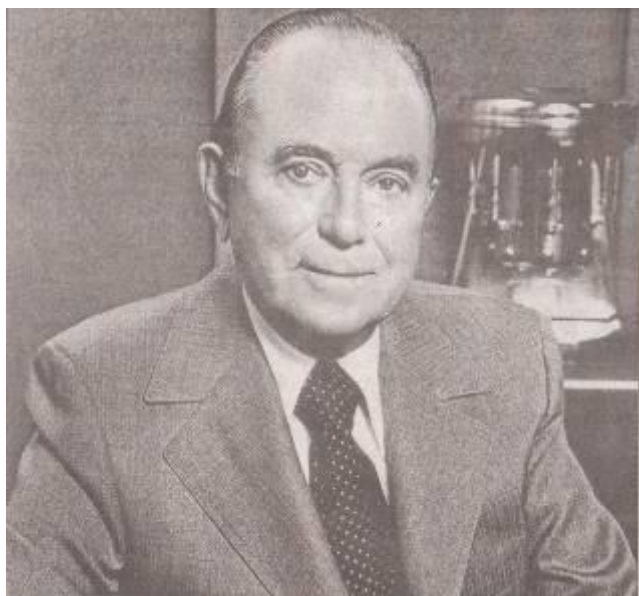
Рей Крок – основатель «MacDonald's Corporation»

Человек, благодаря которому растолстела Америка, был когда-то джазовым музыкантом, торговал всякой-всячиной, пока не забрёл в ресторанчик братьев Мак'Доналдов. Он быстро оценил низкие цены, изменил дизайн, нанял персонал, установил на крыше светящуюся букву «М» и снизил цену гамбургеров в два раза. Установил детские площадки, где в подарок малышам дарили мягкие игрушки. Предприимчивый Рей Крок действовал гениально – дети силком тащили родителей в «Макдональдс».