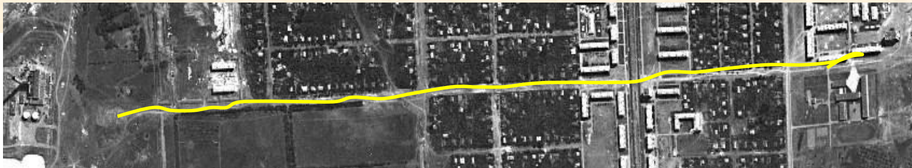
Снимок со спутника 1967 год