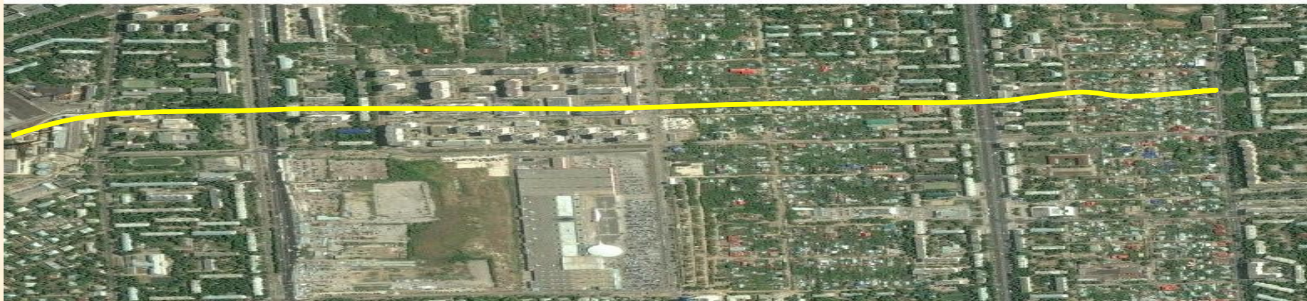
Снимок со спутника 2016 год

Старое название улицы - Восьмой проезд. Переименован 22 апреля 1965 года в честь легендарного генерал-лейтенанта Дмитрия Михайловича Карбышева (годы жизни: 1880-1945).