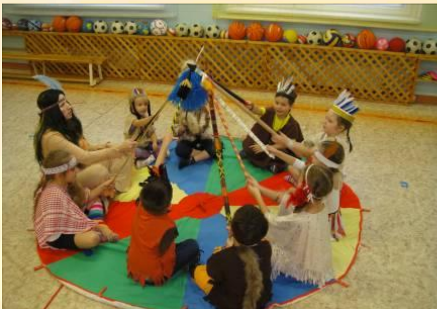
Большой совет индейцев.