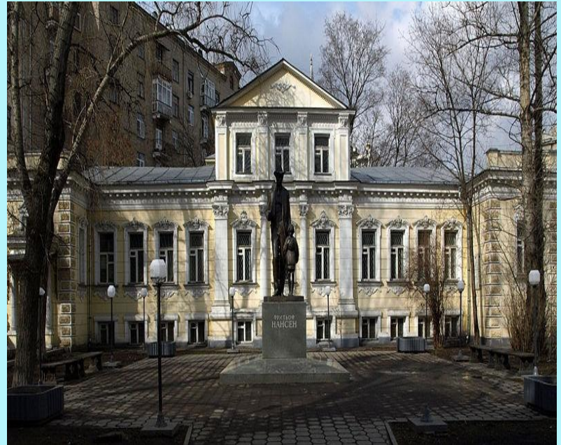
Памятник Нансену в Москве, открытый в 2002 году