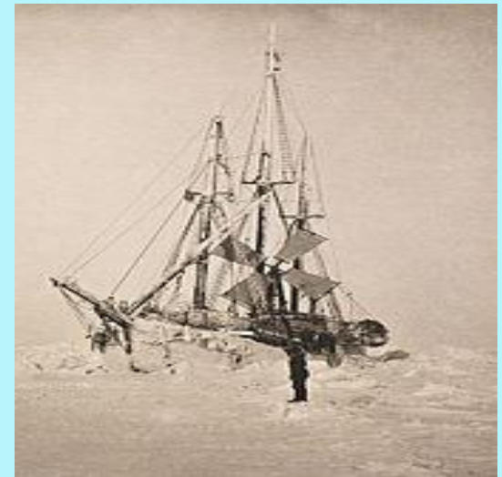
«Фрам» в марте 1894 г.